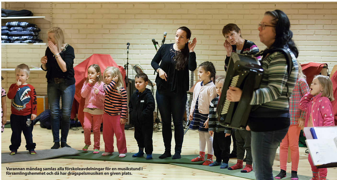
Varannan måndag samlas alla förskoleavdelningar för en musikstund i församlingshemmet och då har dragspelsmusiken en given plats.