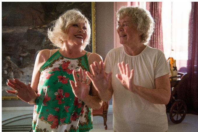
70 är bara en siffra