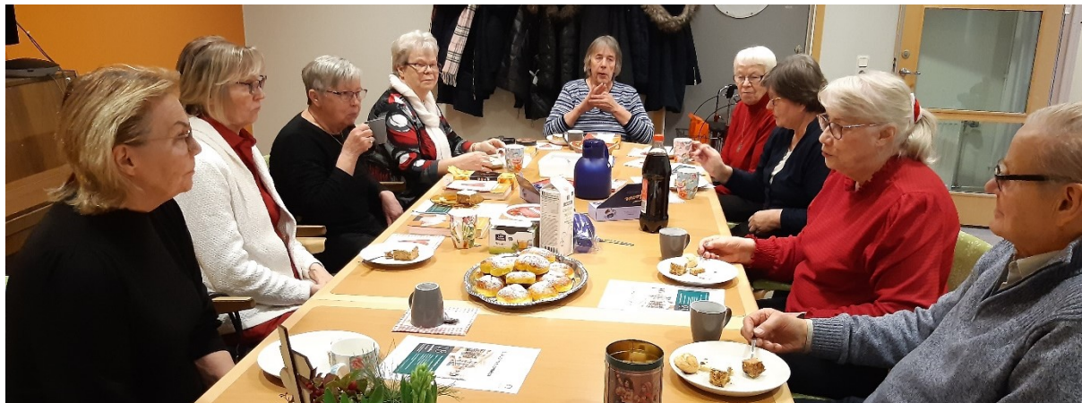
Den finskspråkiga bokcirkelgruppens julavslutning på biblioteket i Södra Ryd.