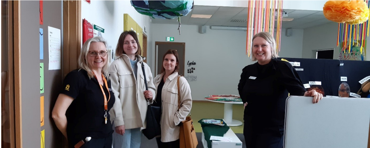
Studiebesök från Laxå kommun på Dalvägens förskola den 28 mars 2022.

Den 28 mars gjordes ett studiebesök till Dalvägens förskola av Laxå kommun. Även styrgruppen för finskt förvaltningsområde har gjort ett studiebesök där under 2022 i samband med att ett av mötena under året förlades till Dalvägens förskola. Den 28 mars hölls även öppet hus på Dalvägens förskola.