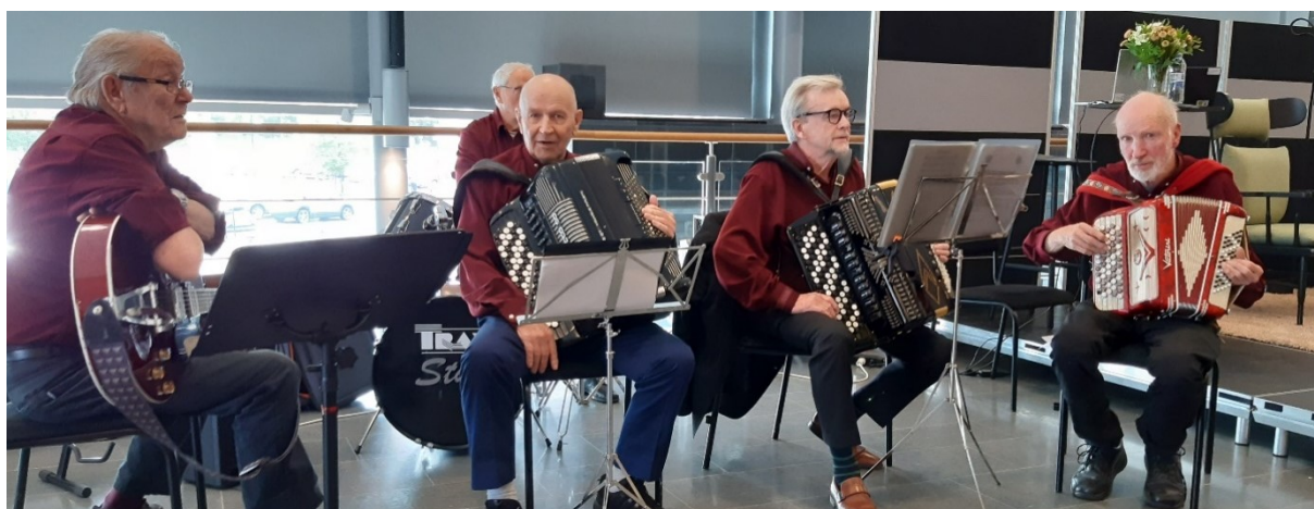
Spelmanslaget Vipinäs Vildar (Vipinän Villit) uppträdde under Seniormässan 2022.