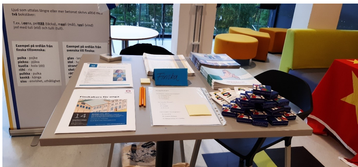
Språkdagen på Västerhöjdsgymnasiet den 26 september 2022.