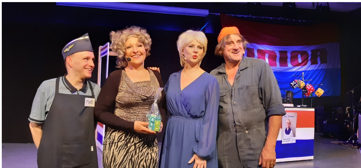
Solisterna från musikalen ”Puhelinlangat laulaa” på Kulturfabriken 3 september.

Den 3:e september visades den finskspråkiga musikalen ”Puhelinlangat laulaa” (Telefonlinjerna sjunger) på Kulturfabriken i Skövde. Publikantal: 171 personer.