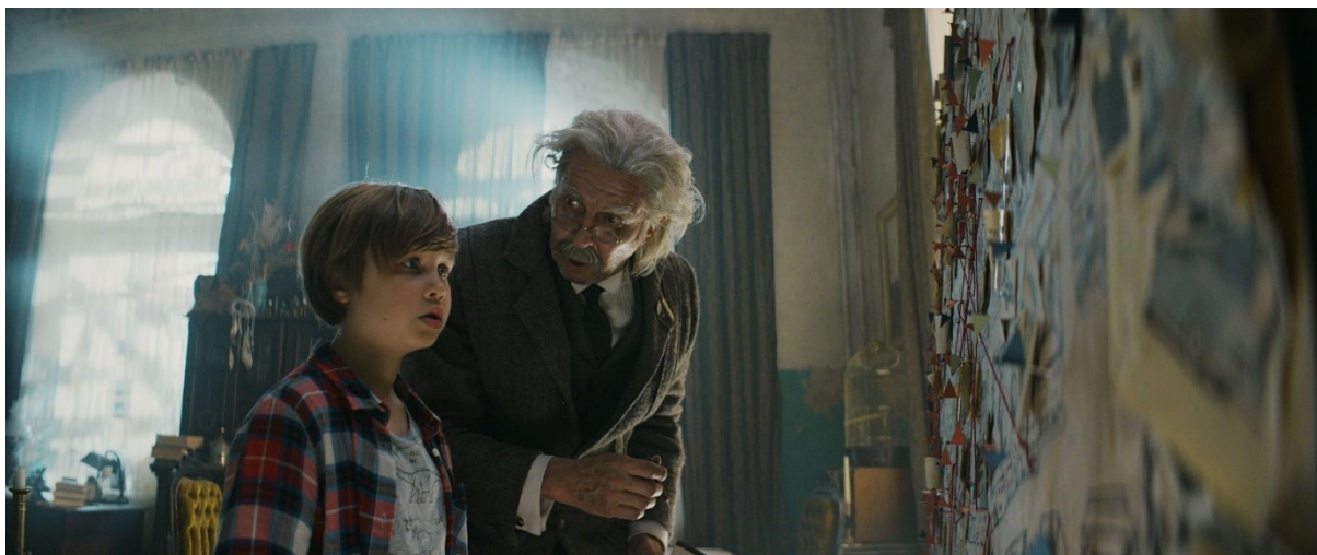
Vinski och osynlighetspulvret (Vinski ja näkymättömyyspulveri)

Under 2022 visades två finska filmer för barn på biograf Odeon: Adas och Gladas vinter (Onnelin ja Annelin talvi, 15 besökare) under sportlovsveckan och Vinski och osynlighetspulvret (Vinski ja näkymättömyyspulveri, 18 besökare) under höstlovsveckan.