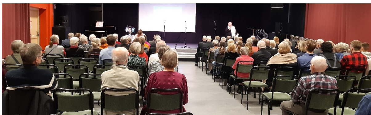
I Timboholmssalen ordnades ett program för firandet av Finland självständighetsdag 3/12.

På Självständighetsdagen den 6:e december hölls en ceremoni vid minnesmärket för Finlands krigsveteraner vid tidigare Finlandiahemmet. Musikern Valto Savolainen komrade när en manskör sjöng. Efter detta spelade Valto för de boende på fastigheten Mariehov 2, som numera ägs av Skövde Blocks ( www.skovdeblocks.se )