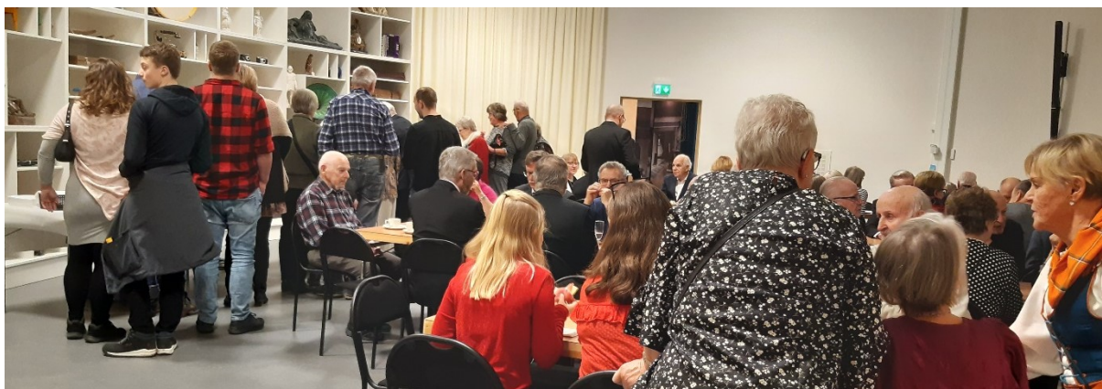
Servering i Askebergasalen på Kulturfabriken under firandet av Finlands självständighetsdag den 3:e december.