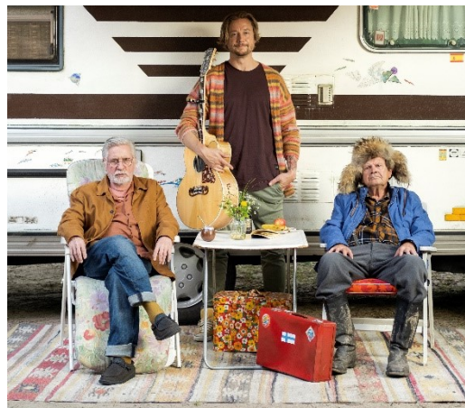
Kverulanten på jakt efter en Escort