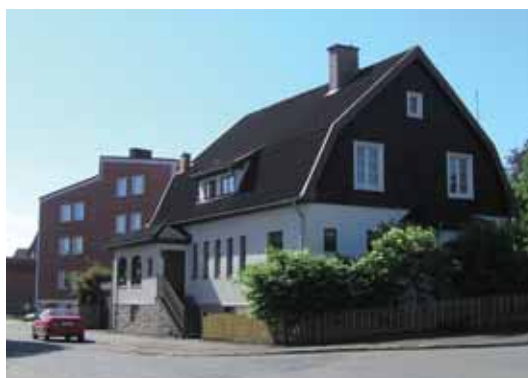
Domherren 8 Vårfrugatan 3 byggdes 1923 med F.A. Neuendorf som arkitekt.

Domherren 7 Lumbergatan 7 ligger som en liten herrgård placerad i fonden av gatan. Husets karaktär av både stram nationalromantik och 1920-talets lätta klassicism är typisk för den tiden och är mycket väl bevarad. Detta är en av Västermalms viktigaste byggnader ur kulturmiljösynpunkt.