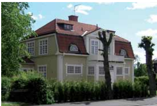
Ovan till vänster: Granen 8 Skolgatan 11/Storgatan 34 byggdes som ett flerbostadshus i rött tegel med drag av 1920-talets klassicism.