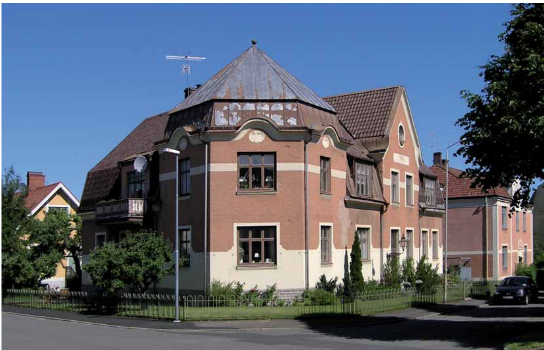
Kråkan 5 vid Alströmersgatan//Frygiigatan från 1913-14 är ett av Västermalms välbevarade bostadshus i villastil från 1910-talet.