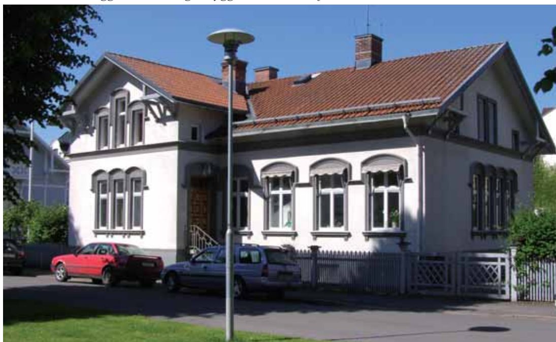
Castor 2 Drottninggatan 10, troligen byggd 1882, var det första stenhuset i Villastaden.