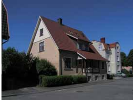
Höken 2 Vårfrugatan 9 byggdes 1913 med F.A. Wahlström som arkitekt.