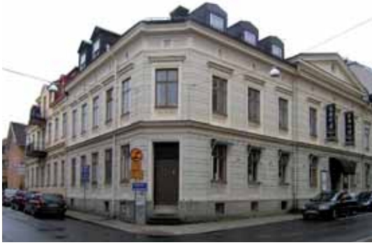
Höder 3 med bostadshuset från 1887 med fasader i tidstypisk putsarkitektur.