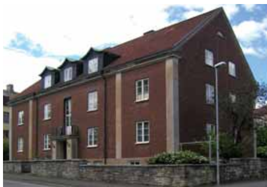
Lärkträdet 4 med välbevarad exteriör i 1920-talsklassicism från 1929 är ett av de första hus i Skövde som byggs med stomme av gasbetong.