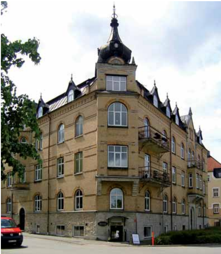
Lejonet 7 från 1906-07 är ett av flera ståtliga borgerliga hyreshus från 1900-talets början som tillsammans bildar en monumental inramning till Vasaplansplan.