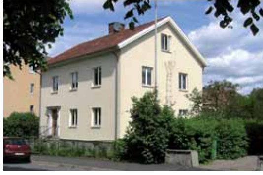
Bocken 8 från 1937 inreddes ursprungligen med två lägenheter.