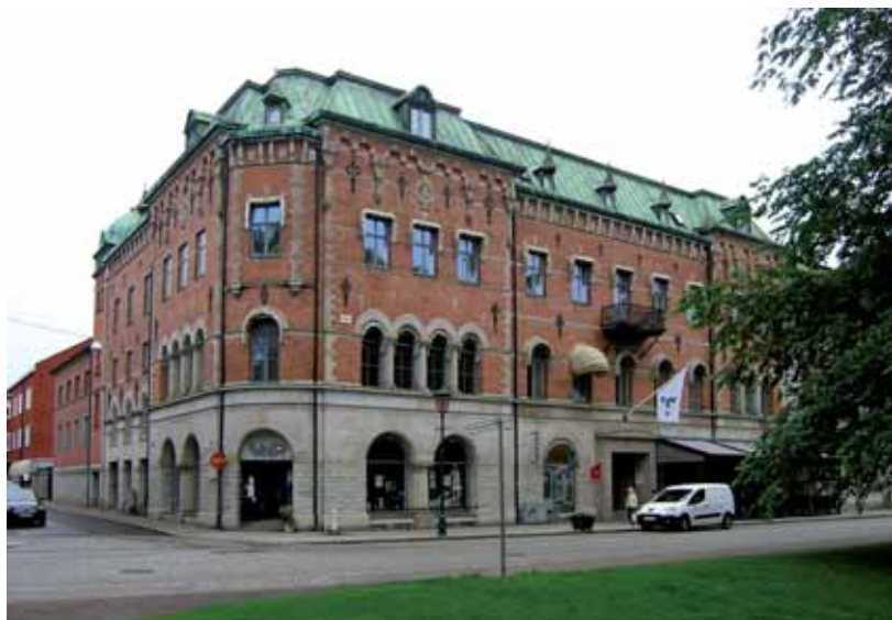
Fjolner 5, det monumentala f.d. bankhuset vid Hertig Johans gata uppfördes 1894.

byggnads Aktiebolag som byggherre. På nybyggnadsritningarna var hotellet disponerat med matsal, schweizeri, biljardrum med mera i bottenplanet. I våningen ovanför fanns en stor festvåning. En del av byggnaden var avsatt som lokal för stadens frimurarloge. Antalet rum för resande uppgick till 23. Hotellet gavs ett framträ-