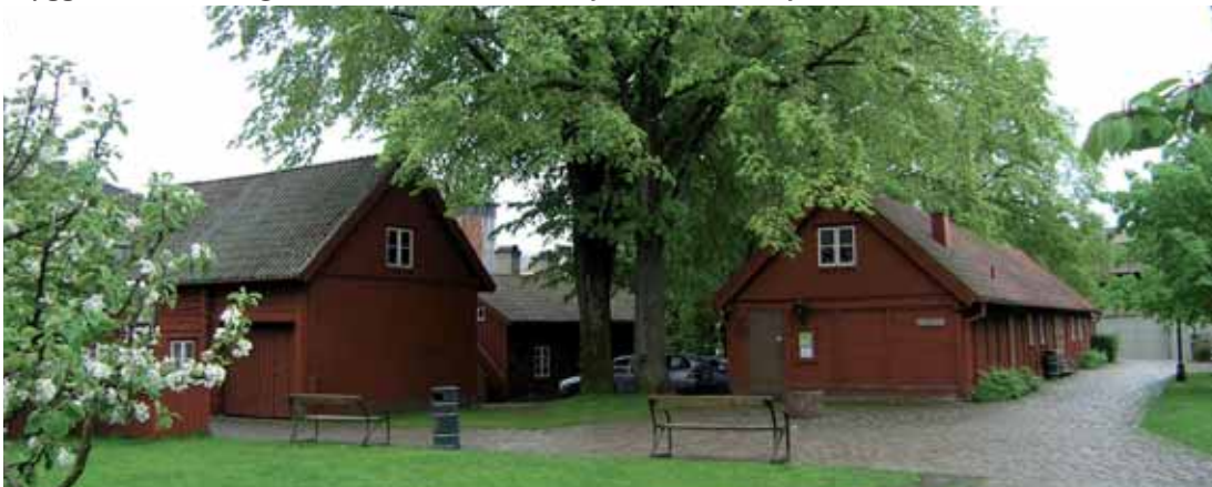
Bryggaren 10 Heléngården som härstamma från 1700-talets första del.

Den utpekade bebyggelsen är av sådant värde att den bör omfattas av Nya PBL 2 kap. 6§ 3:e st., 8 kap 17§ och 8 kap. 13§. För att säkerställa det kulturhistoriska värdet bör kommunen undersöka behovet av att fortsätta komplettera befintlig detaljplan med en bevarandeariktad detaljplan enligt 5 kap. PBL. En närmare dokumentation bör göras av den bebyggelse som uppmärksammats 2009-2011 för första gången.