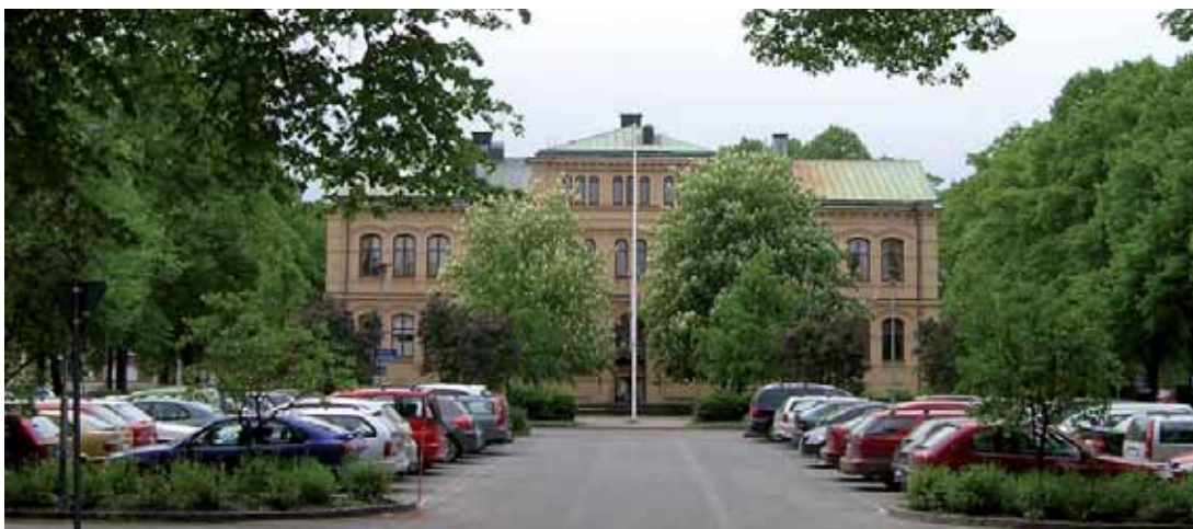
Eric Ugglas plats med Gamla läroverket (f.d. Eric Ugglas skola) från 1877 från söder. Eric Ugglas plats med anslutande gator som huvudaxlar är en mycket viktig del av 1877 års stadsplan.

fanns anläggande av esplanader, trädplanterade och breda nog att framtida eldsvådor skulle kunna hindras från spridning.