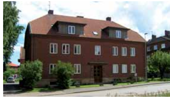
Poppeln 5 Varnhemsgatan 3 är ett av flera hus kring Läroverket från 1920-30-talen med röd tegelfasad och klassicistiska detaljer.

Hyreshus med tegelfasader från 1930. Byggherre var lantbrukare FA Ålander och arkitektfirman FA Neuendorf & Son upprättade ritningar till huset. Utöver att tegel, i likhet med flera andra hus i området använts som fasadmateriäl, har man utnyttjat tegel som dekorativt element. Detta märks i de rusticerade hörnkedjorna och portalens utsmyckning, men även i taklisten och de svagt profilerade fönsteromfattningarna. Takkupor har tillkommit i sen tid, möjligen i samband med inre ombyggnader 1983. Likaså är fönstren utbytta, medan entrédörrar är bevarade sedan byggnadstiden. Det smidesstaket mellan tegelplintar som tidigare avgränsat trädgården från gatan saknas numera.