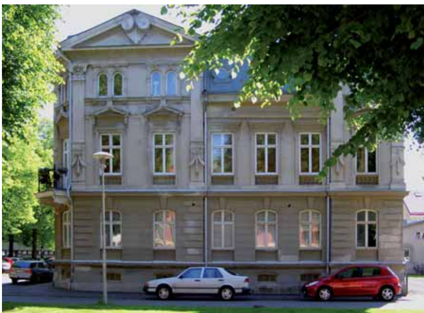
Pollux 6 från 1888-89 var det första hyreshuset i Villastaden. 1880-talets rikhaltiga putsarkitektur är väl bibehållen som helhet, trots en viss förenkling av fasaddetaljer.