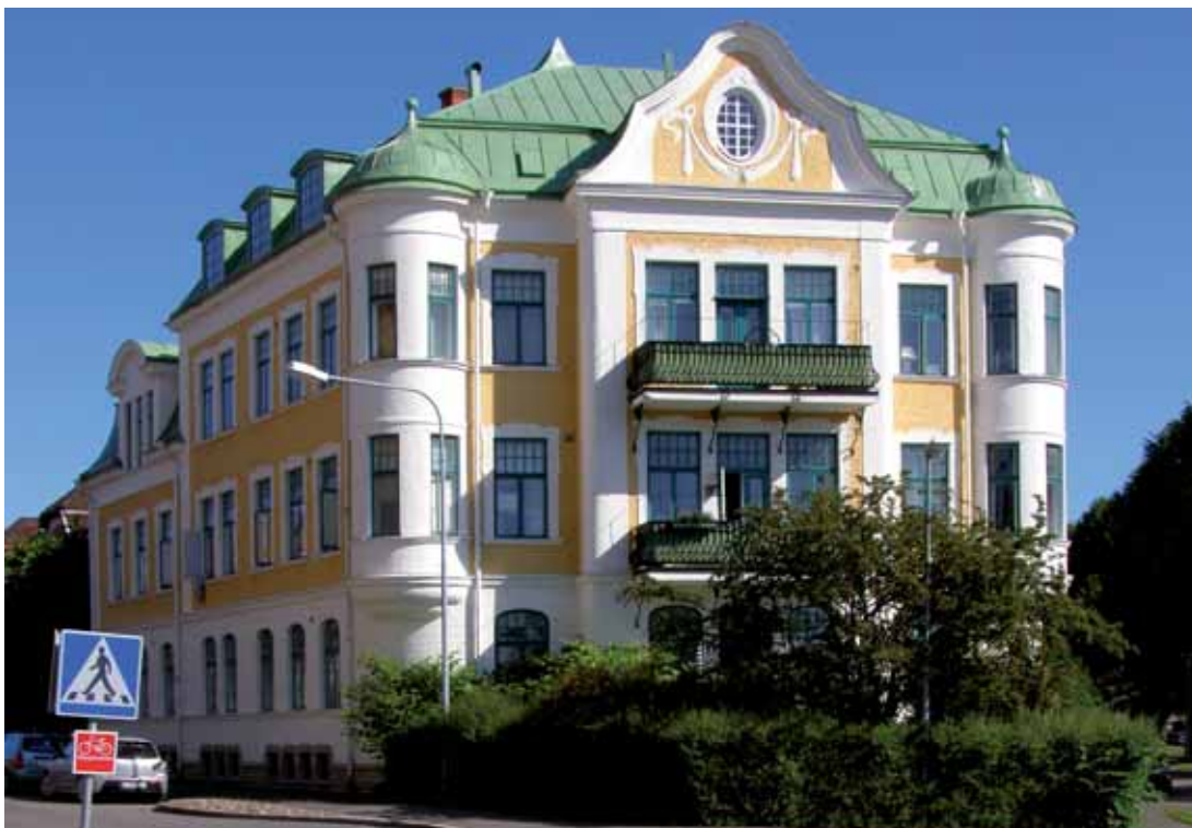
Orion 4 , Drott- ninggatan 20/ Storgatan 41, uppfördes 1904 och bildar jämte Eken 2 och Lejo- net 1 en mag- nifik inramning till Vasaplan.