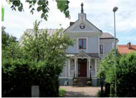
Bävern 16 Sturegatan 16 uppfördes 1903-1904 som ordenshus för Logen 2003 S:ta Helena av IOGT.