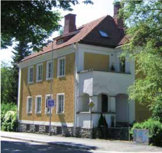
Hjärpen 1 Alströmersgatan 15. S. Bergvägen 9 En genuin gammal villaträdgård, med prägel av tidigt 1900-tal, ramar in detta tidstypiska bostads- hus för två familjer, byggt 1922.