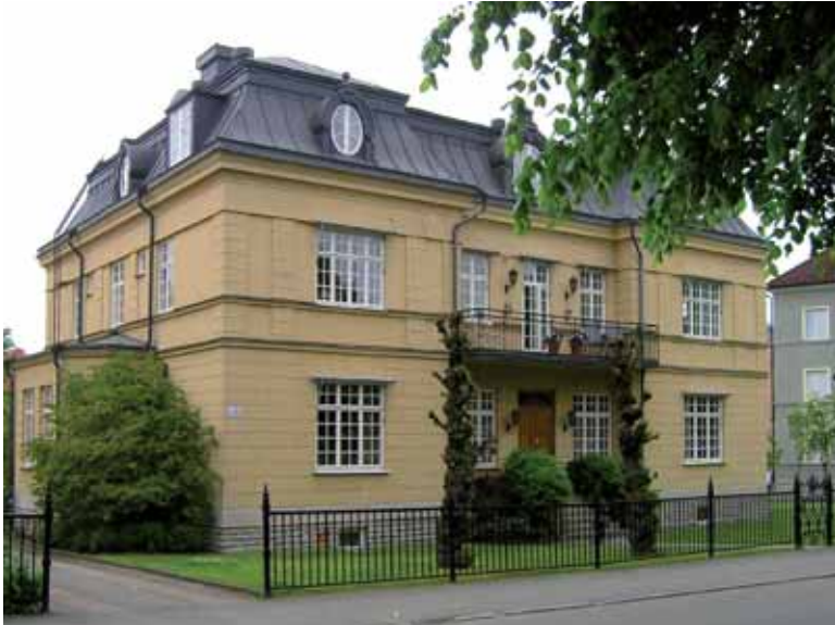
Till vänster: Björken 11 vid Vasagatan uppfördes 1903 som en exklusiv privatvilla.