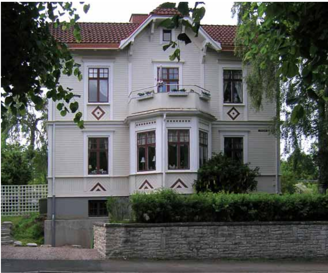
Büvern 2 Sturegatan 2 bevarar en tidstypisk och karaktäristisk panelarkitektur från tidigt 1900-tal.