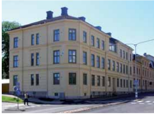
Jupiter 9, f.d. 3 Kungsgatan 1. 1878 byggdes huset som kan ha varit det första i den nya Villastaden.