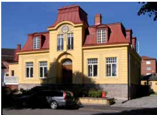
Orion 2 Drottninggatan 16 är uppfört 1902 och är fortfarande ett fint exempel på förra sekelskiftets stilpåverkan av fransk senrenässans och jugend.