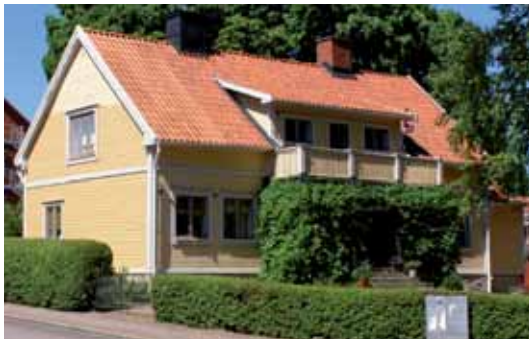
Häggen 23, Skolgatan 20/Richerts gata 8. Kommunistergården är ursprungligen från ca 1825, alltså ett av Skövdes äldsta hus idag. Nuvarande exteriör präglas av en ombyggnad 1923, en karaktär som är välbevarad.