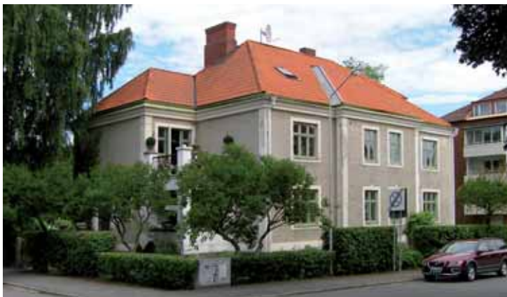
Granen 1 Torgilsgatan 5 är en av Vasastadens mest välbevarade 1920-talshus. Huset uppfördes efter ritningar av arkitekt F.A. Neuendorf åt byggmästare Oscar Johansson.