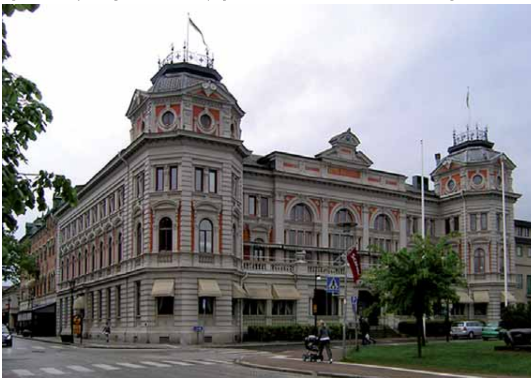
Fjolner 7 , Hotell Billingen är ett magnifikt exempel på 1880-talets monumentala praktbyggnader. I Skövde var detta stadens mest representativa byggnad. Hotellet fick en central placering i stadsbilden, exponerat mot järnvägen som var den nya pulsådern och en motor i Skövdes utveckling.