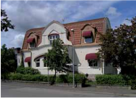
Bävern 14 Sturegatan 10 byggdes 1915 i en vildestil med drag av jugend efter tyska förebilder.