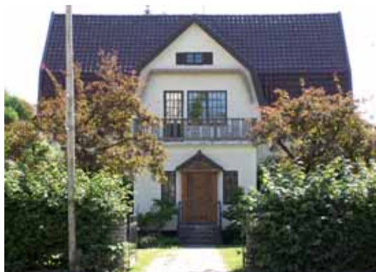
Castor 5 Storgatan 31 byggdes ursprungligen 1881, men byggdes om helt 1916-17, utformat i den tidens karaktäristiska villastil.