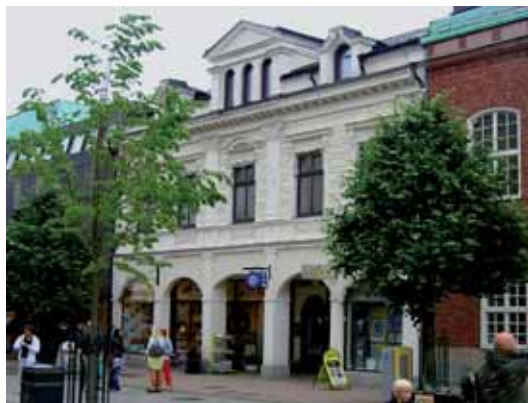
Heimdal 19 (f.d. 17) har mot Hertig Johans torg en representativ huvudfasad från 1880-talet.

Rådhusgatan 13/Hertig Johans gata 16 omfattar det då nya kommunalhus som Skövde stad lät uppföra 1933-34 med F.A. Neuendorf&Son som arkitekt. På denna hörntomt som ägdes av staden stod sedan 1853 ett tvåvånings timmerhus som revs våren 1933. Den nya förvaltningsbyggnaden skulle – förutom butikslokaler i bottenvåningen – inrymma lokaler för fattigvårdsstyrelsen samt för stadsfiskalen med flera polisiära myndigheter. Huset stod klart för inflyttning den 1 oktober 1934. På 1950-talet inrymdes här lokaler för kommunalborgmästaren, stadsbyggnadskontoret, och drätselkammarens kansli. Byggnadens exteriör med tegelfasader och tandsnittslist under valmat tegeltak är ett fint exempel på en offentlig bygg-