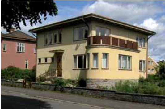
Bocken 6 med tvåvånings enfamiljsvilla från 1937 med välbevarad exteriör i utpräglad funkisstil.