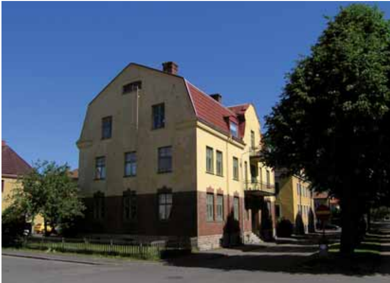
Morkullan 1 vid Alströmersgatan/Vårfrugatan från 1913-14 är en av Västermalms ståtligaste och mest välbevarade bostadshus från 1910-talet.