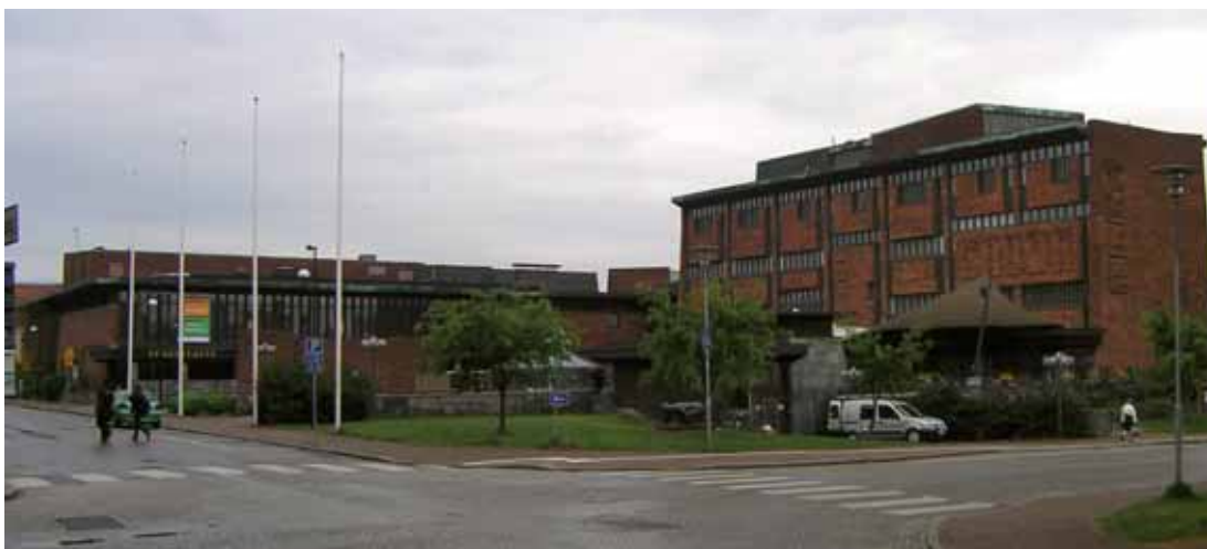
Oden 3,4 Kulturhuset med Hans-Erland Heineman som arkitekt invigdes 1964. Byggnadsminnesutredning av Oden 3,4 pågår.