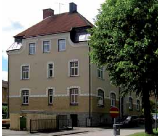
Lejonet 6 Vasagatan 3 byggdes 1910-11. Exteriören är välbevarad, frånsett ny, modern fönstertyp, i likhet med flera andra hus i kvarteret.