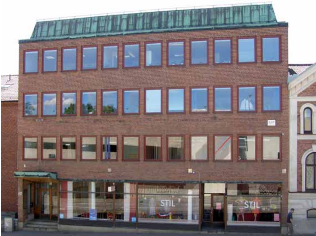
Häggen 21 , Kungsgatan 21. Affärs- och kontorshus från 1960 som fortfarande är ett mycket gott exempel på modernism från övergången 1950-60-tal.