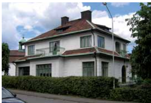
Asken 3 Torgilsgatan 4 från 1905-06.