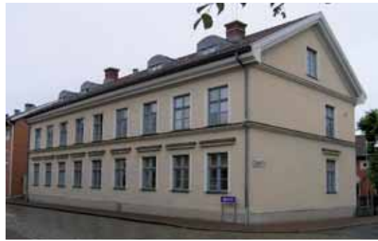
Sigyn 2 med bostadshuset från 1869.

1900 nybyggdes stallbyggnaden i en representativt utformad tegelarkitektur i samklang med övriga byggnader. Järnstaketet mot Mörkegatan tillkom samtidigt med stallet.