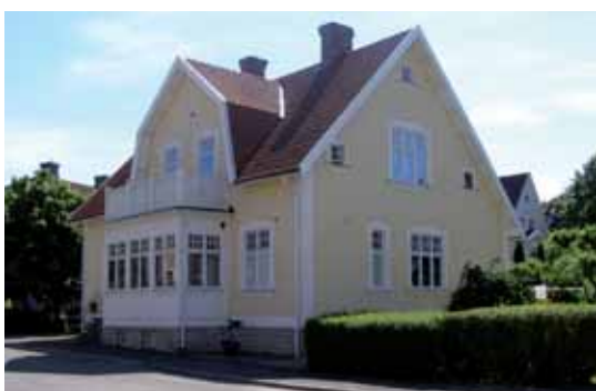
Kajan 3 Frygiigatan 11. Slätputsad villa i 1 ½ våning med jugendkaraktär.