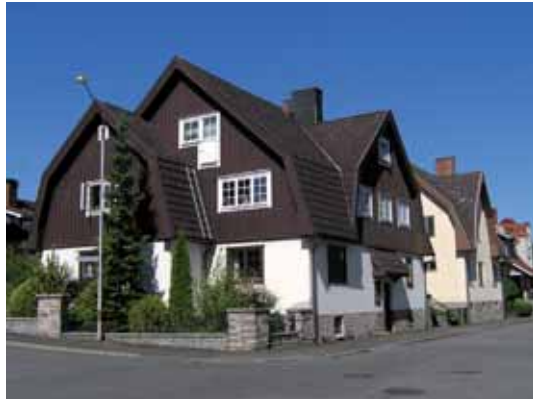
Höken 3 Vårfrugatan 7 och Höken 4 Vårfrugatan 5 byggdes båda 1922 med F.A. Neuendorf som arki- tekt. Båda utformades med drag av den tidens nationalromantiska villastil.

Nedan: Höken 1 , Alströmersgatan 19. Det stora hörnhuset med tre gavelfasader är ett av de äldre på Västermalm, uppfört 1913-14.