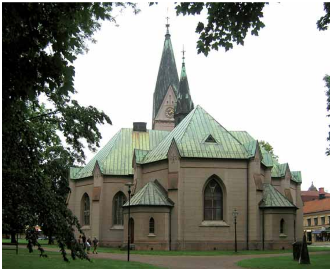
Skövde 4:321 Sankta Helena kyrka från 1100-1200-talen, om- och tillbyggd efter stadsbranden 1759 och ombyggd med exteriör i nygotik 1888-90.