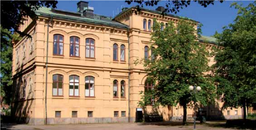
Skövde 4:327 Eric Ugglas skola, f.d. Gamla läroverket uppfördes 1875-77.