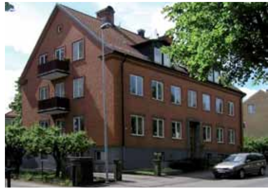
Kamelen 1 Vasagatan 19/Karlskatan 7 är ett litet flerbostadshus i rött tegel med välbevarad prägel av 1930-40-tal med många ursprungliga detaljer.