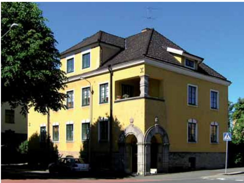
Morkullan 5 vid Alströmersgatan/Södra Bergvägen från 1923-24 är ett av Västermalms välbevarade bostadshus från stadsdelens tidiga år. Genom läget på en hörntomt har huset utformats med hörnpelare och entré i en hörnplacerad portik som utformats som en liten loggia i italiensk barock.