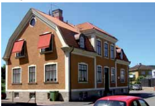
Kråkan 1 Vårfrugatan 19. Villa från 1915 med välbevarad exteriör.