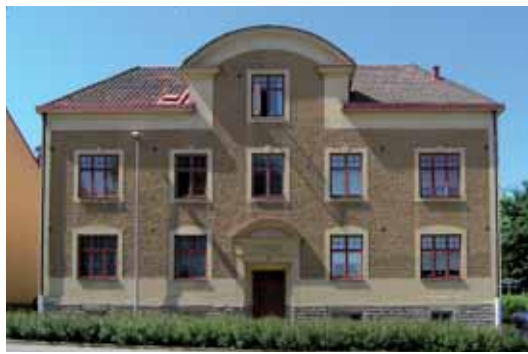
Domherren 2 Varnhemsgatan 8 har en exteriör från 1922 som förändrats mycket litet sedan huset byggdes.