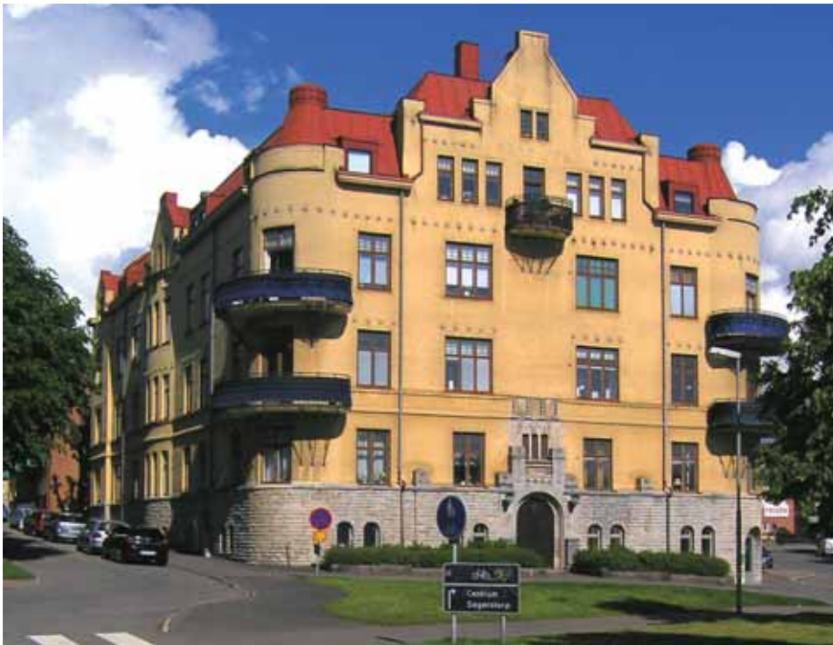
Eken 2 från 1905-06 bildar tillsammans med grannhuset på Orion 4 en monumental inramning till Vasaplan som anlades samtidigt som husen byggdes.