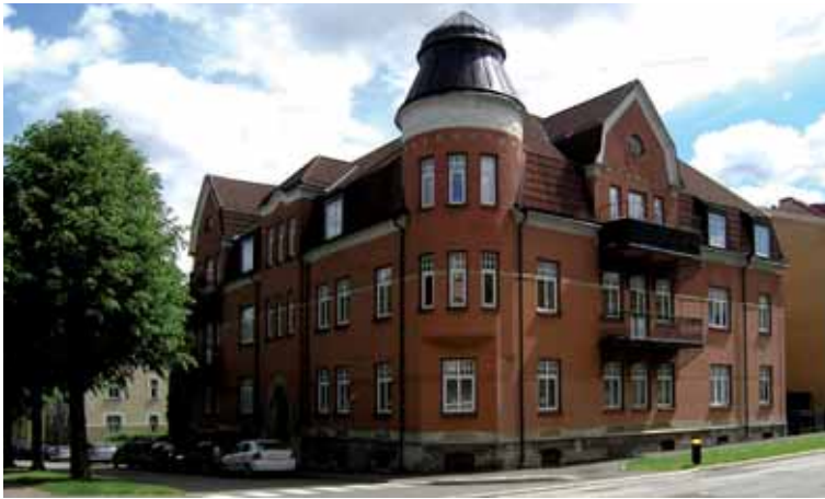
Lejonet 5 Vasagatan 5 byggdes 1913-15