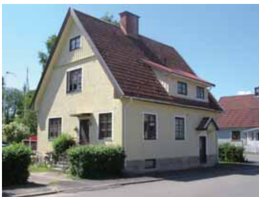
Kajan 1 Frygiigatan 15. Reveterad enfamiljsvilla i 1 ½ våning uppförd 1922.