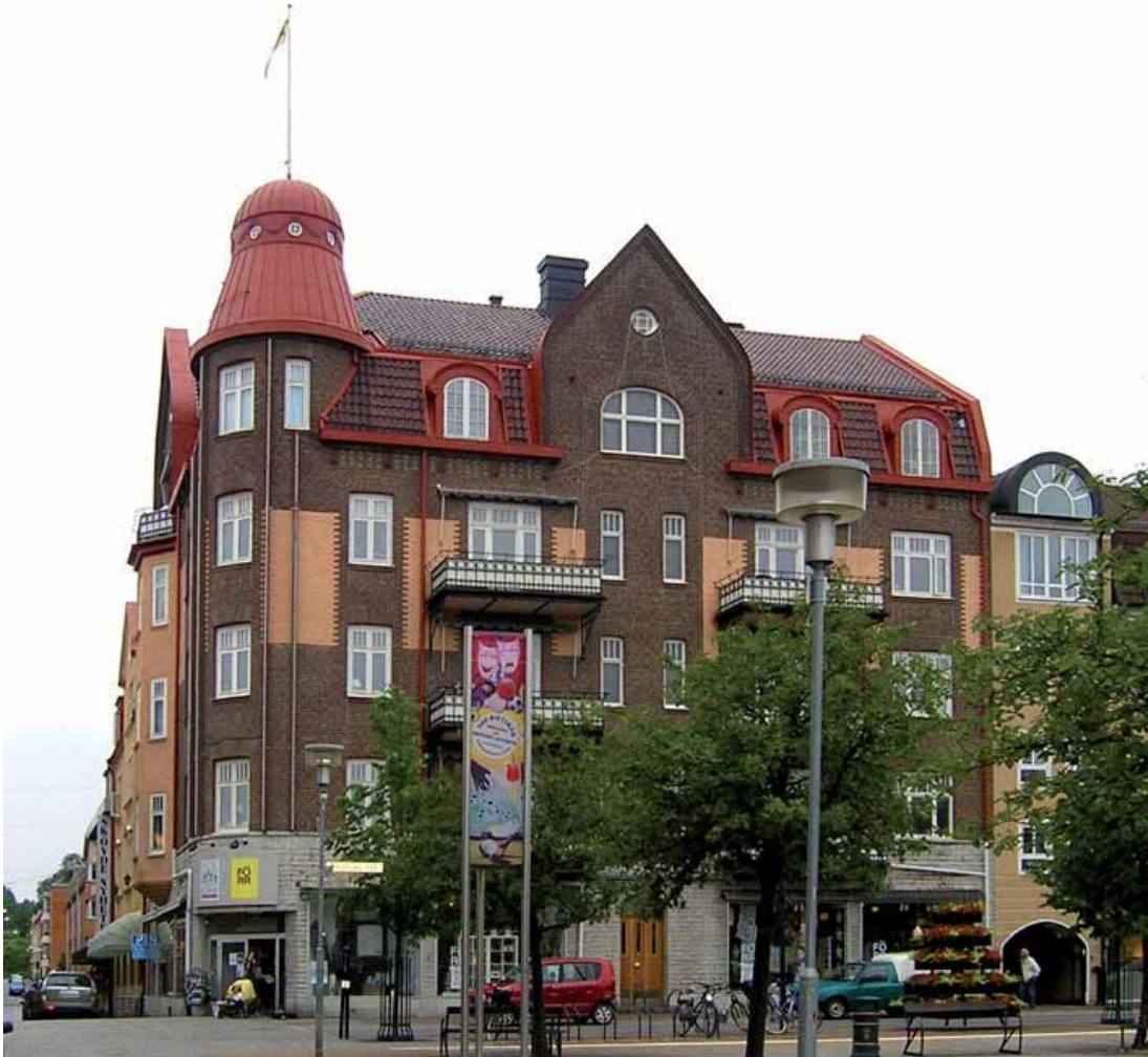
Tyr 6 , Rådhusgatan 4. Handlare Jönssons monumentala bostads- och affärshus vid Sandtorget är kanske Skövdes främsta exempel på det tidiga 1900-talets intresse för nationalromantik med jugenddrag.