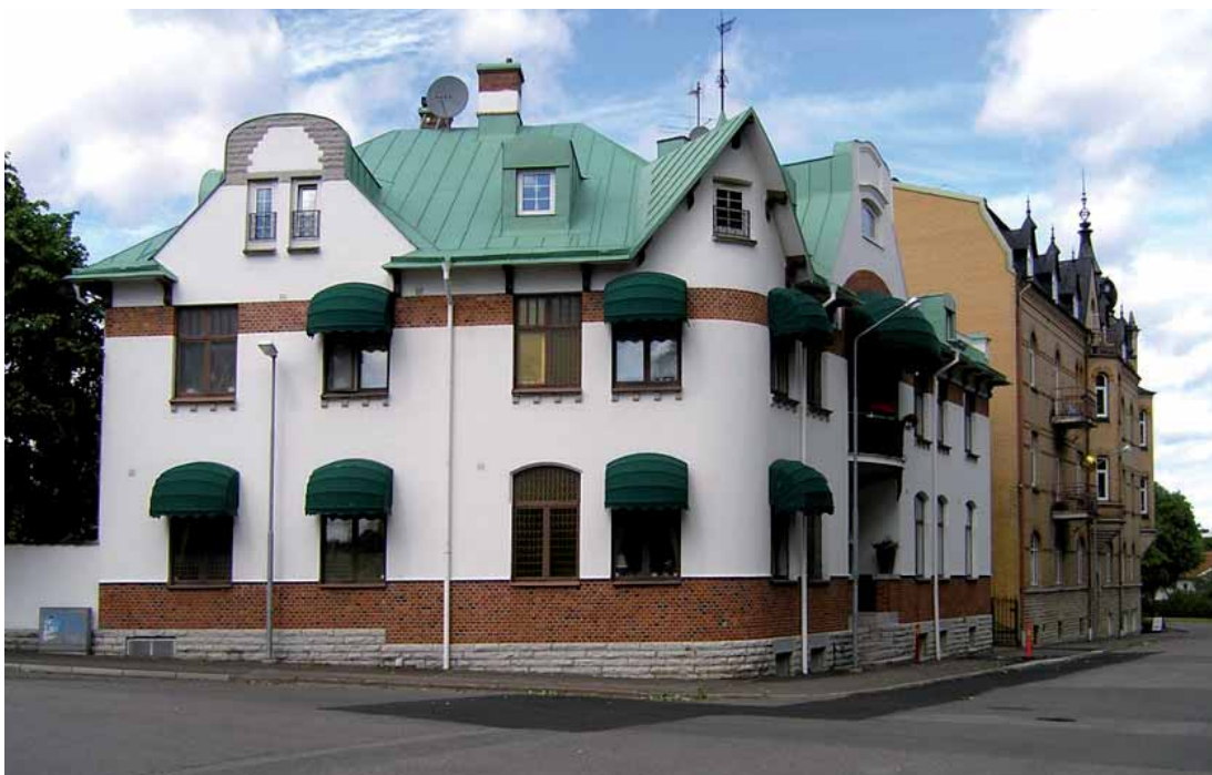
Lejonet 1 Järnvägsgatan 4 med välbevarad exteriör från 1908-09.