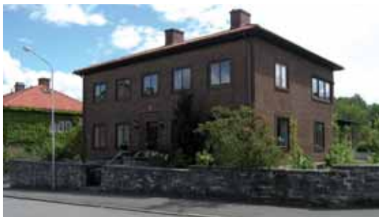
Lärkträdet 8 byggd 1936 i en stram, funkis-inspirerad villastil.