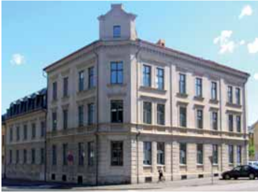
Jupiter 1 Prinsgatan 1. Huset byggdes 1899-1900 i en tidstypisk lite stram putsarkitektur. Det inrymde då post och telegraf.