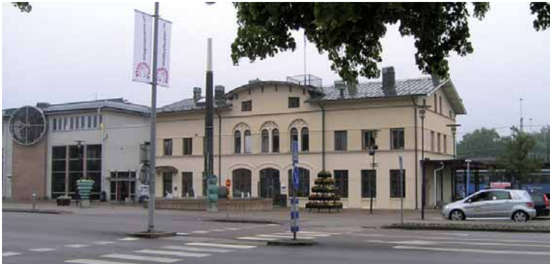
Skövde 6:1 Stationshuset från 1859 har ett mycket starkt symbolvärde p.g.a. järnvägens enorma betydelse för Skövdes positiva stadsutveckling. Stationshuset ingår sedan 1993 i Resecentrum.

här låg även fram till 1872 Skövde kyrkoherdebo-ställe. I centrum av höga lövträd, planteringar och gångsystem står en springbrunn med skulpturen Gyllen från 1950 utförd av Helge Johansson. En grupp av gamla gravvårdar har i sen tid ställts upp öster om kyrkans kor. Främst är det kalkstensvårdar av traditionell typ från 1700- och tidigt 1800-tal.