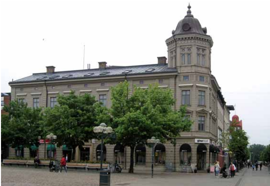
Loke 4 Landinska huset från 1884 vid Hertig Johans torg är ur kulturhistorisk synpunkt en märkesbyggnad i innerstadens kulturmiljö.

tomtkartan som hörde till bygglovhandlingarna. Det ståtliga Landinska huset stod för något nytt i Skövdes stadsbild med sin ljusa rikt artikulerade putsarkitektur och sitt monumentala hörntorn. Denna karaktär finns fortfarande väl i behåll. Fönstren är senare utbytta. Huset är ur kulturhistorisk synpunkt en märkesbyggnad i innerstadens kulturmiljö, med mycket stark stadshistorisk förankring. Ingår i värdefull kulturmiljö kring Hertig Johans torg.