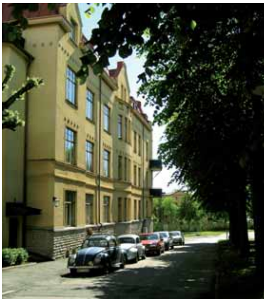
Eken 2 från 1905-06 vid Drottninggatans esplanad.

Eventuell ny bebyggelse placeras med stor hänsyn till befintlig och ges en god utformning.