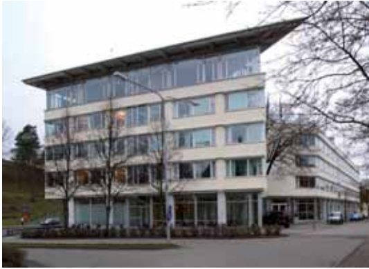
Skomakaren 7 Stadshuset från 1990.