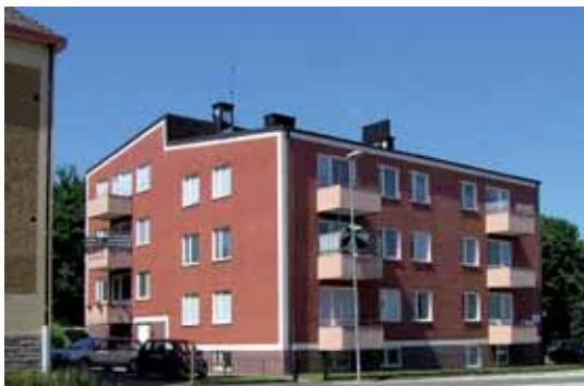
Domherren 1 Varnhemsgatan 6 byggdes 1958-60 och har i stort den karaktären i behåll.