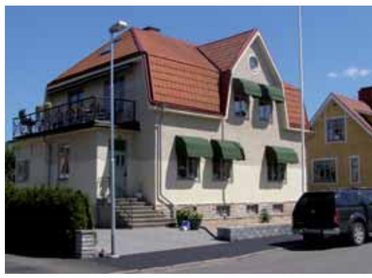
Kråkan 7 Frygiigatan 14 byggdes 1913-14.