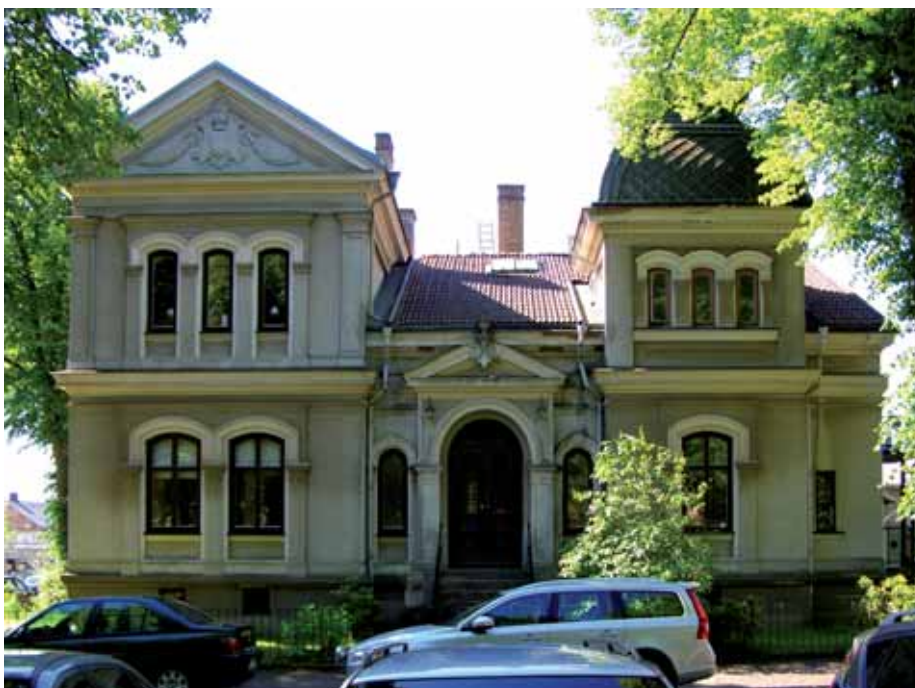
Pollux 1 Vil- lagatan 1 upp- fördes 1887 för borgmästare Hedenstierna. Exteriören är fortfarande väl- bevarad, trots en viss förenk- ling av putsde- taljer.