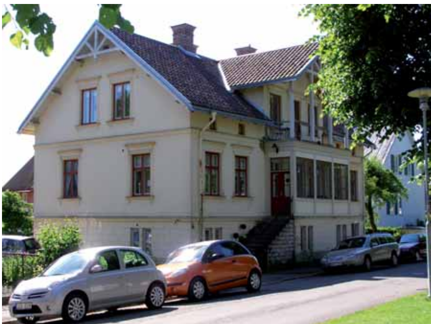
Pollux 5 uppfördes 1885 och oavsett små moderniseringar på 1920-talet är 1880-talskaraktären mycket välbevarad.