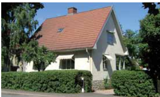
Kajan 8 Vasagatan 44. Enfamiljsvilla byggd 1922.