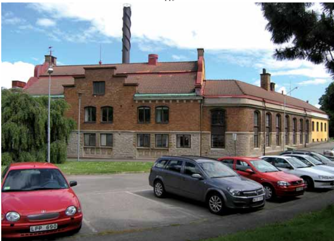
Lönnen 7 Elverket, vars nuvarande äldsta delar uppfördes 1908-09.

Badhusgatan 22, Kungsgatan 25, Kungsplan Elektricitetsverk, vars nuvarande äldsta delar uppfördes 1908-09 efter arkitekt Ernst Wahlanders ritningar. Byggherre var Sköfde Elektricitetsverk, som redan 1899-1900 hade uppfört sin första byggnad, sammanbyggd med stadens nya varmbadhus. Komplexet byggdes på den plats vid Badhusgatan, där det nya energiverket ligger sedan 1977. Elektricitetsverket/badhuset revs 1974-75. Den idag äldsta byggnadsdelen ligger i hörnet av Kungsgatan och Kungsplan, och försåg de nya stadsdelarna Vasastan, Västermalm m.fl. med elektricitet. Byggnadens gatufasader är utförda av kalksten och hårdbränt tegel, medan gårdsfasaderna är putsade. År 1927 tillbyggdes 1909 års byggnad mot söder efter FA Neuendorfs ritningar, en tillbyggnad som helt anpassades till Wahlanders arkitektur. Den nuvarande trappstegsgaveln tillkom 1944 i samband med genomgripande ombyggnader och 1950 tillbyggdes efter arkitekt Vilhelm Anderssons ritningar det slätputsade ställverket vid södra tomtragränsen.