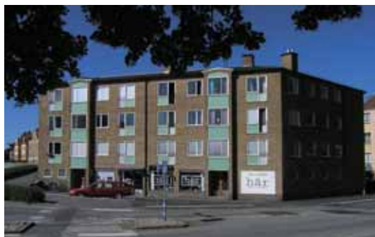
Bofinken 5. Flerbostadshuset vid Kungsplan har fortfarande en fin helhet av 1950-tal, trots att det genomgått en del sentida förändringar.