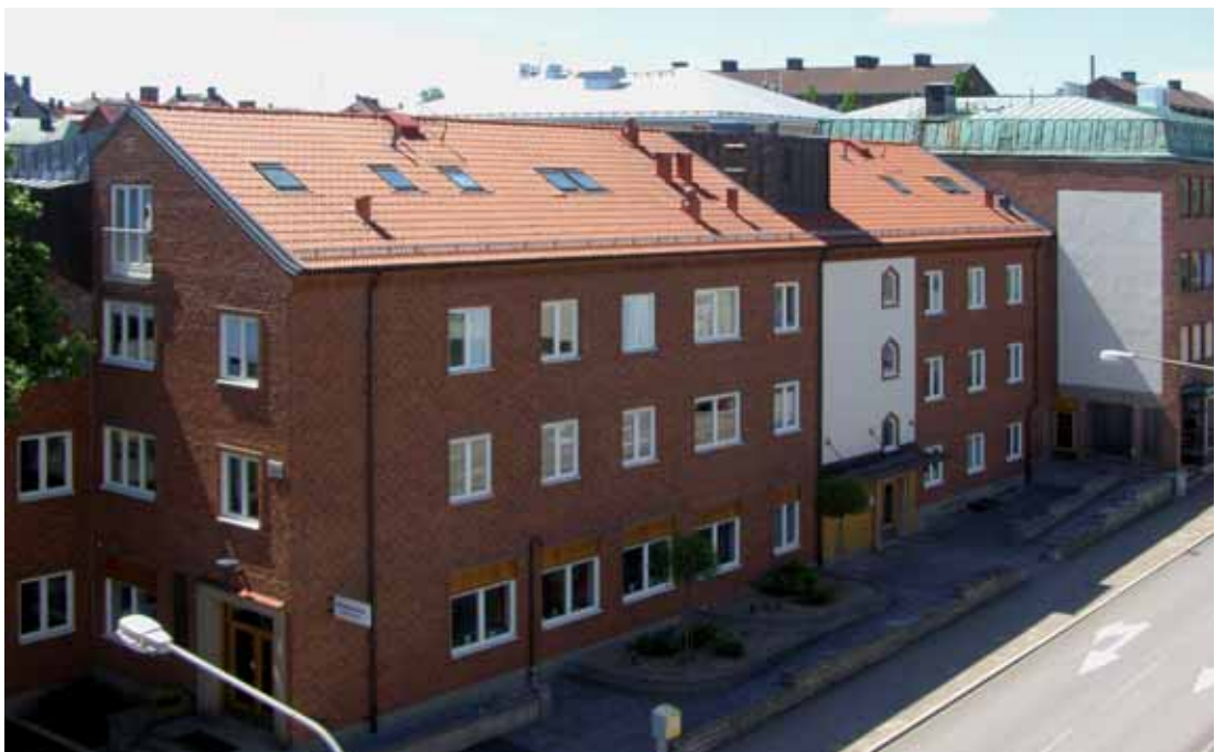
Häggen 16 , Kungsgatan 19/Richertsgatan 2. Flerbostadshus som uppfördes 1953 och i mångt och mycekt har en tidstypisk exteriör i behåll, t.ex. den röda tegelfasaden, det kontrasterande trapphuset i vit puts med spetsbågiga småfönster, samt entréernas glasade, lackade trädörrar.