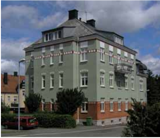
Lejonet 2 Nils Ericssons gata 4 byggdes 1914.