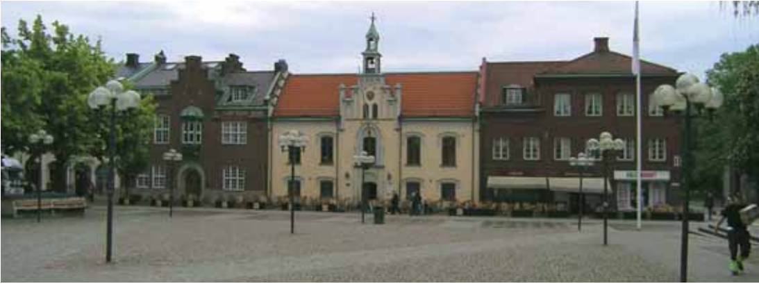
Heimdal 20 (f.d. 5) med stadens f.d. kanslihus (1915-16) och gamla rådhuset (ursprungligen 1775-76) samt Heimdal 18 med f.d. kommunalhuset (1933-34). Den välbevarade kulturmiljön markerar att Hertig Johans torg inte endast är stadens gamla kommersiella knutpunkt utan även varit dess administrativa centrum.

med rådhuset från 1700- 1800-tal, kanslihuset från 1910-talet och f.d. kommunhuset från 1934. Gamla tomstukturer och småskalig kvartersbunden bebyggelse från 1800-talets mitt och senare del längs Hertig Johans gata, Det sena 1800-talets representativa byggnader med bankhus och Hotell Billingen i kvarteret Fjolner. Resecentrum med stationshuset från 1859, det kommunikativa navet i Skövdes moderna utveckling. Större bostads-, affärs- och offentligbebyggelse från 1880-1940, t.ex. Loke 1. Modernismens Skövde med kvartersbunden flervånings affärs- och bostadsbebyggelse från 1930-1960-tal vid båda torgen samt Commercevaruhuset från 1966. Karaktärsfulla, välbevarade gaturum framför allt kring Kyrkparken med Kyrko-