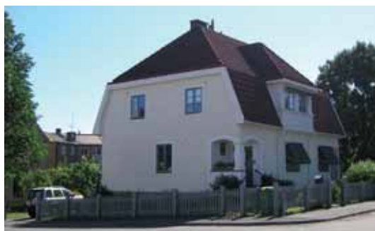
Bofinken 4 byggdes 1923.