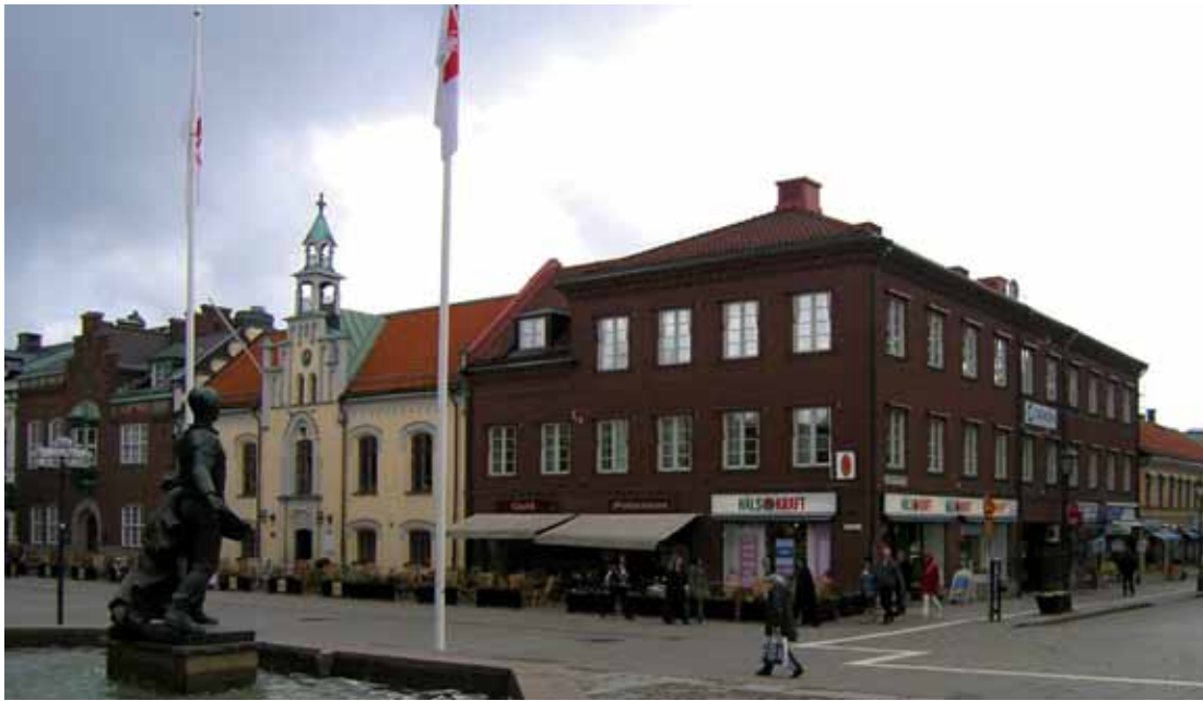
Heimdal 20 (f.d. 5) och 18. Från vänster syns det nationalromantiska f.d. kanslihuset från 1915-16, i mitten Gamla Rådhuset från 1775-76, ombyggt 1853. Till höger står det f.d. kommunalhuset, uppfört

ler. Vid ombyggnaden höjdes övervåningen något, men den store skillnaden var den originella torgfasaden ”i blandad götisk och gammal tysk stil”. Klocktornet flyttades till den nya frontespisen och kortsidorna pryddes med trappgavlar. Rådhusets putsfasad avfärgades i ljus gulockra med grå listverk och bruna fönstersnickerier, en färgsättning som återställdes på 2000-talet. Den gamla funktionen med borgmästare och råd bibehölls till 1938. Byggnaden innehöll från 1952 till in på 2000-talet lokaler för Skövde Museum, numera inryms här bl.a. café. Gamla Rådhuset är idag Skövdes äldsta icke-kyrkliga byggnad av sten och är ur kulturhistorisk synpunkt en omistlig del av Skövdes stadsbild. Gamla Rådhuset ingår i en värdefull kulturmiljö kring Hertig Johans torg.