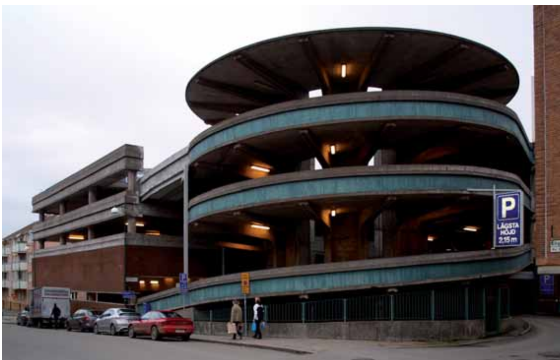
Idun 6 Parkeringshuset till dåvarande Domus ritades vid KF:s arkitektkontor och stod klart 1968, försedd med en karaktäristisk "snurra". Byggnaden med den välbevarade snurran är en viktig representant för sin tid och för Skövdes intensiva stadsutveckling på 1960-talet.

gen från Mariesjö tegelbruk i Skövde. Dessutom förekommer trä, koppar och skiffer. Karaktäristiskt för anläggningen är bl.a. de okonventionellt svagt lutande ytterväggarna som tillsammans med olika former av mönstermurning ger byggnaderna en skulptural framtoning. Detta intryck förstärks av ornamenten som ofta framträder först på nära håll, t.ex. "livstecknet", en keramisk platta som återkommer på flera platser i fasaden. Den konstnärliga utsmyckningen har efterhand utökats med verk av flera kända konstnärer. Byggnaderna har senare genomgått vissa förändringar. Eftersom samma arkitektkontor har haft hand om såväl nybyggnaden på 1960-talet som senare åtgärder har de omgestaltningar som gjorts väl integrerats i den arkitektoniska helheten. Byggnadsminnesutredning av Oden 3,4 pågår.