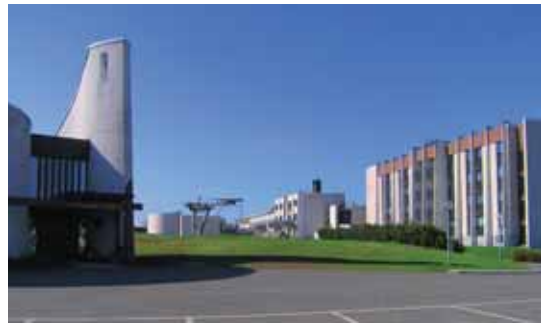
Hotell- och rekreationsanläggningen Billinge, inklusive Sankt Lukas kyrka, från 1968-70 är en modernistisk klenod i Västra Götaland. Billinge är av mycket stort kulturhistoriskt värde.

- miljöer för rekreation och social samvaro , t.ex. parker, modern fritid, idrott,