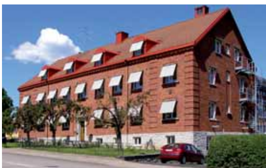
Häggen 14, Skolgatan 22 Flerbostadshus i rött tegel, uppfört 1929 efter ritningar av skövdearkitekten Vilhelm Andersson. 1920-talsexteriören är väl bibehållen.