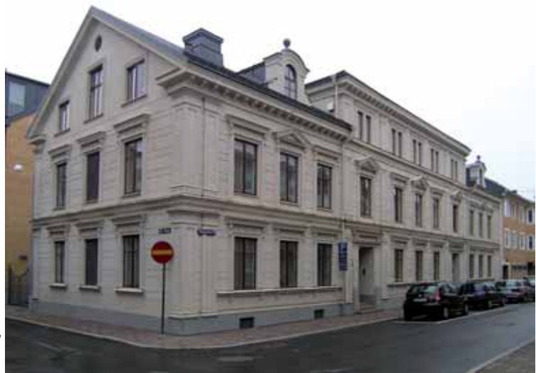
Skade 1 med det ståtliga bostadshuset från 1864 med putsfasader från 1876-77.