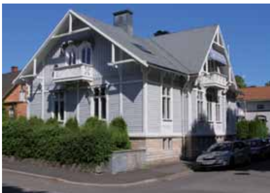
Castor 3 Drottninggatan 12 har sin tidstypiska panelarkitektur från 1893 fortfarande i behåll.