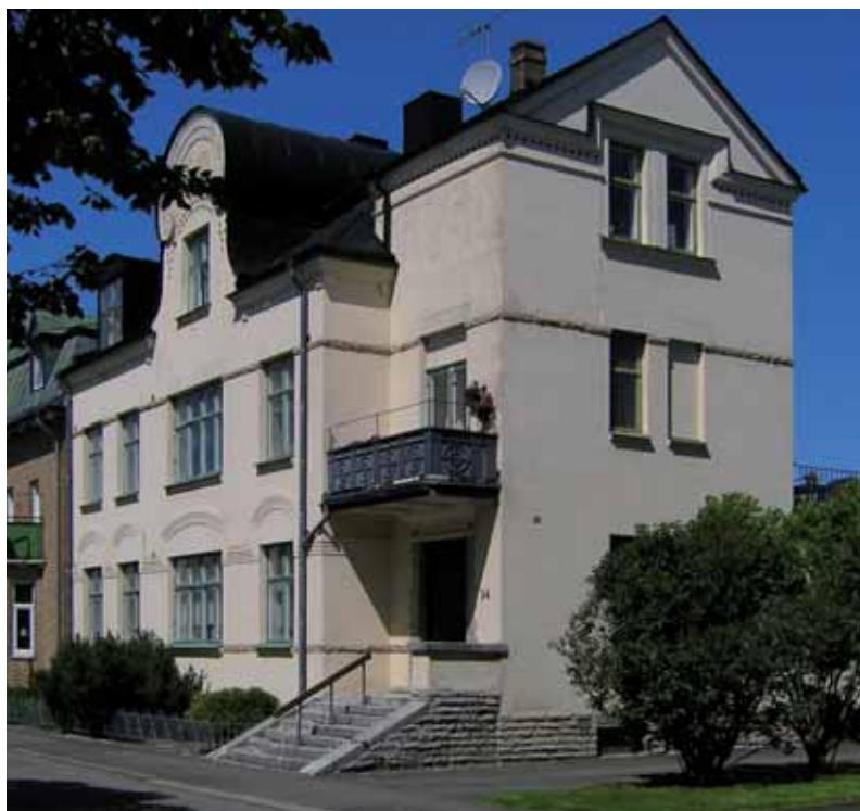
Lärkan 7 Vasagatan 34. Det monumental huset byggdes 1909-10 och är ett mycket gott exempel på det tidiga 1900-talets detaljrika mångfald där drag av olika arkitekturstilar sammanförts till en helhet.