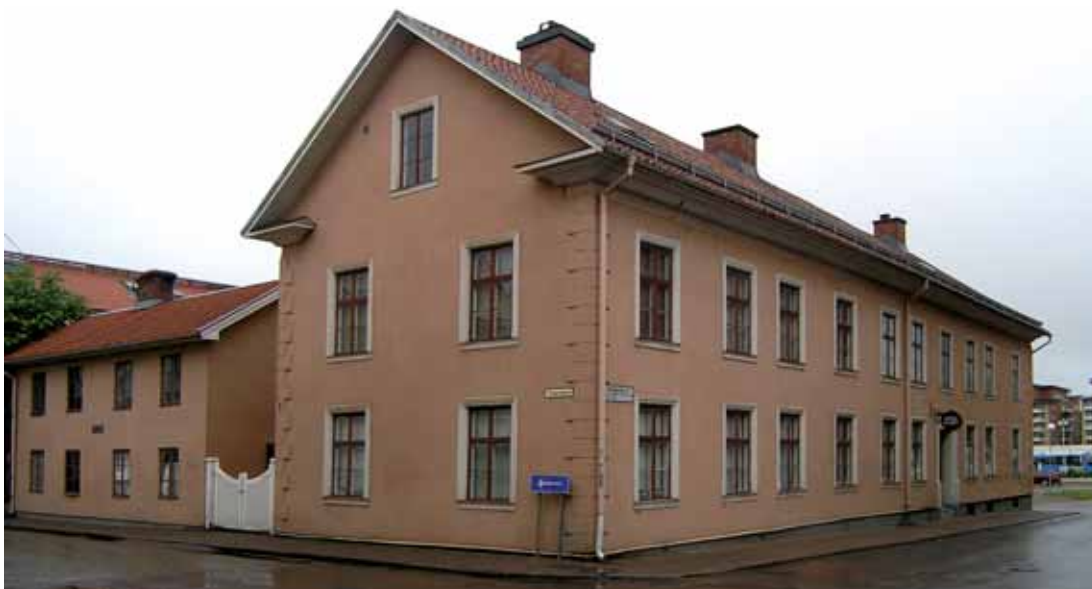
Tor 2 är av särskilt intresse eftersom det bildar en byggnadshistorisk länk mellan det tidiga 1800-talets agrara småstad och den expansiva utveckling som följde med järnvägsbygget 1859.

till trädgård. Fastigheten utgör dessutom fortfarande ”en hel tomt” från 1760 års stadsplan och är storleksnässigt oförändrad sedan dess. Snickaren 1 är idag innerstadens bäst bevarade gårdsmiljö med den gamla trädstadens småskaliga karaktär från 1850-1900. Mot den bakgrunden är Snickaren 1 av mycket stort kulturhistoriskt intresse och av största vikt för Skövde ur stadshistorisk synpunkt.