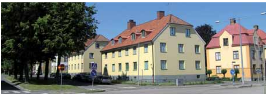
Domherren 9 vid Vasagatan byggdes så sent som 1946, men volym, putsfasader och avvalmade gavlar knyter an till de äldre bostadshusen på Västermalm.

gedörrar och balkongfronter i sinus-korrugerad plåt. Kuperad tomt med trappa upp till gården. Mot Varnhemsgatan liten förgård med tidstypiskt smidesstaket.