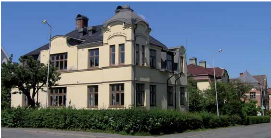
Kajan 5 Alströmersgatan 30 är en av Västermalms äldsta och mest välbevarade villor, byggd 1909.