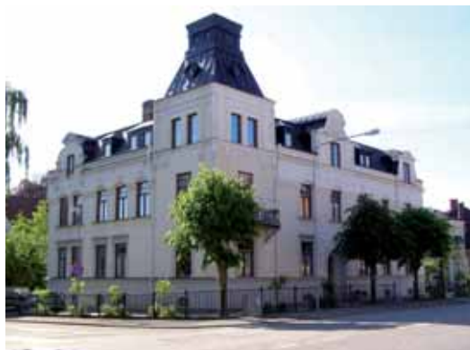
Orion 7 Storgatan 35 byggdes 1905-06 och har i mångt och mycket jugendkaraktären i behåll.