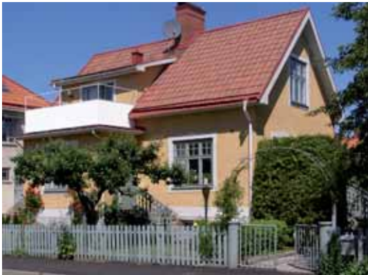
Kråkan 6 Frygiigatan 12 uppfördes på 1910-talet.