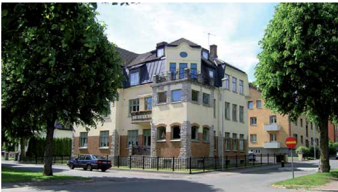
Kamelen 3 vid hörnet av esplanaderna Torgilsgatan och Vasagatan byggdes 1911-1912.

en grupp med enhetligt utformade byggnader, huvudsakligen samlade kring Wennerbergs gata. Det fick prägel av institutions- och borgerligt bostadsområde och domineras av det nya läroverk som uppfördes på Vårfruplatsen 1930. Läroverket byggdes med fasader i rött tegel och de stora tegelvolymerna kom under det närmaste årtiondet att få ett stort inflytande på den närmaste omgivningen. I läroverkets närhet byggdes på 1930-talet ett flertal villor och hyreshus med rött fasadtegel, detta under en period där annars ljusa färger dominerade byggandet.