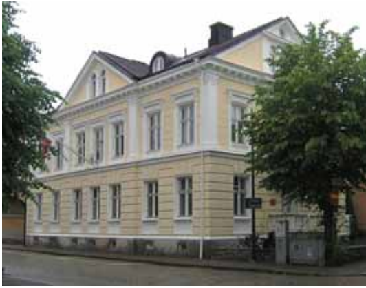
Balder 2 Ahlstrandska huset från 1874.

bibehålla vad som fortfarande återstår av äldre gatunät, tomtstruktur och bebyggelse och se det som en kvalitativ resurs i dagens levande stadsmiljö. Parkanläggningar, trädplanteringar och kvarvarande gatstensbeläggningar bevaras. Den utpekade bebyggelsen bör underhållas med traditionella material och metoder som tar hänsyn till det kulturhistoriska värdet. Den bebyggelse som uppmärksammats 2009-2011 bör dokumenteras närmare. Ny bebyggelse placeras med hänsyn till befintlig och ges en god utformning. Särskild hänsyn visas värdefulla gaturum såsom Sankta Helenagatan vid kvarteren Fjolner, Gerd och Höder, samt Torggatan vid Gamla Skolan och Snickaren (se nedan för närmiljö 1:1 Hertig Johans torg och Kyrkparken).