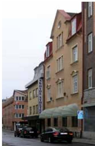
Flygeln mot sidogatan behåller i stora drag sin utformning från ombyggnaden i tidigt 1900-tal.

1906-07 lät handlanden Adolf Alander bygga ett mindre hyreshus med butiksklokal mot sidogatan Torggatan, eventuellt med F.A. Wahlström som arkitekt. En vinkelställd gårdsflygel ombyggdes redan 1911 till bostadshus efter arkitekt Ernst Wahlanders ritningar. Gathuset bibehåller i huvudsak sin lite enklare jugendkaraktär från 1907 med putsfasad, profilerade omfattningar och överst på fasaden en frontespis. Huvudentrén borttogs troligen på 1930-talet då lokalerna anknöts till det stora huvudhuset mot torget. Fönstren är bytta i sen tid.