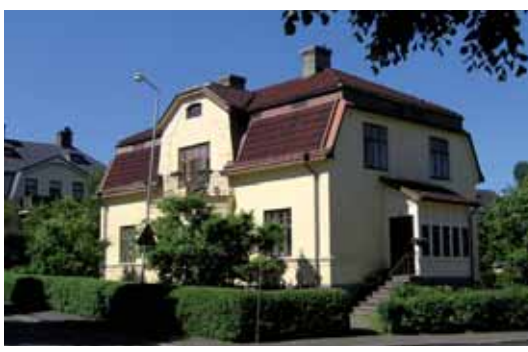
Kajan 4 Alströmersgatan 28. Villa byggd i tegel med slätputsad fasad år 1909, ett av de äldsta husen på Västermalm.