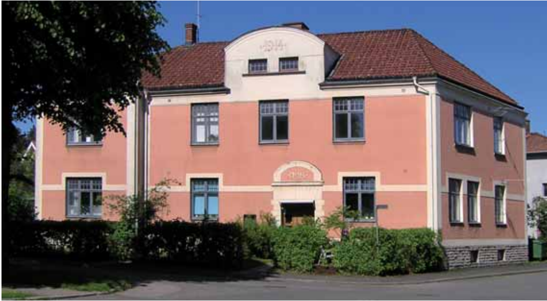
Kråkan 4 , Alströmersgatan 24. Bostadshus i två våningar, byggd 1914, med fyra lägenheter. Välbevarad 1910-talsexteriör.