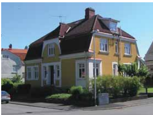
Höken 8 Alströmersgatan 21 byggdes 1908 i en villastil som är karaktäristisk för tidigt 1900-tal.