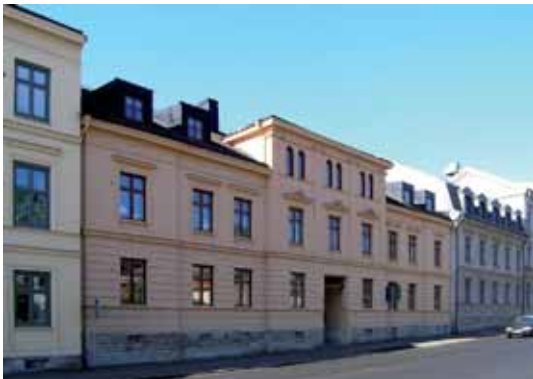
Ovan: Jupiter 2 Kungsgatan 3 byggdes 1878. Nedan: Jupiter 9, f.d. 5 byggdes som flickskola (sedermera flickläroverk) 1880. Den tidstypiska panelarkitekturen är i stort välbevarad.