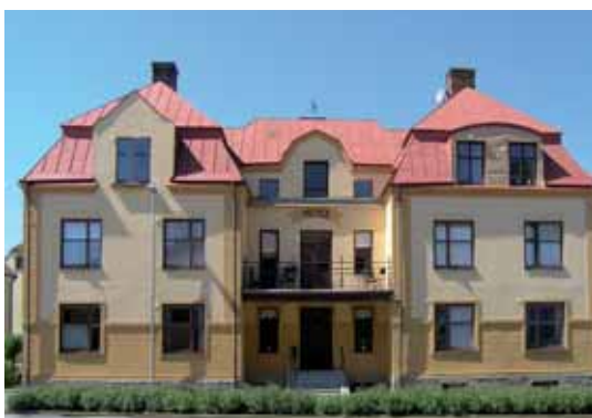
Domherren 3 Varnhemsgatan 10 byggdes 1910 med en exteriör som anknyter både till jugend och nationalromantik. Fönstren är senare förändrade men huset har kvar helheten av tidigt 1900-tal.