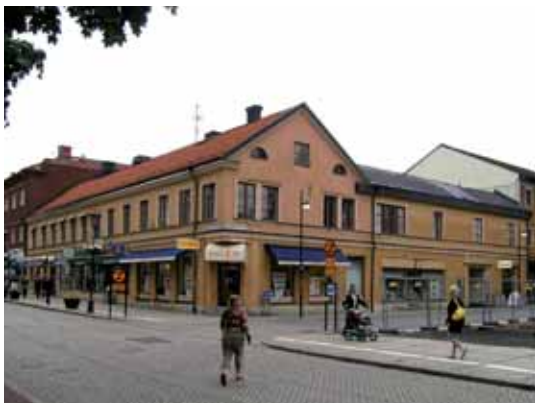
Heimdal 13 är idag en av stadens äldsta gårdsmiljöer i centrum, från 1850- och 60-talet.