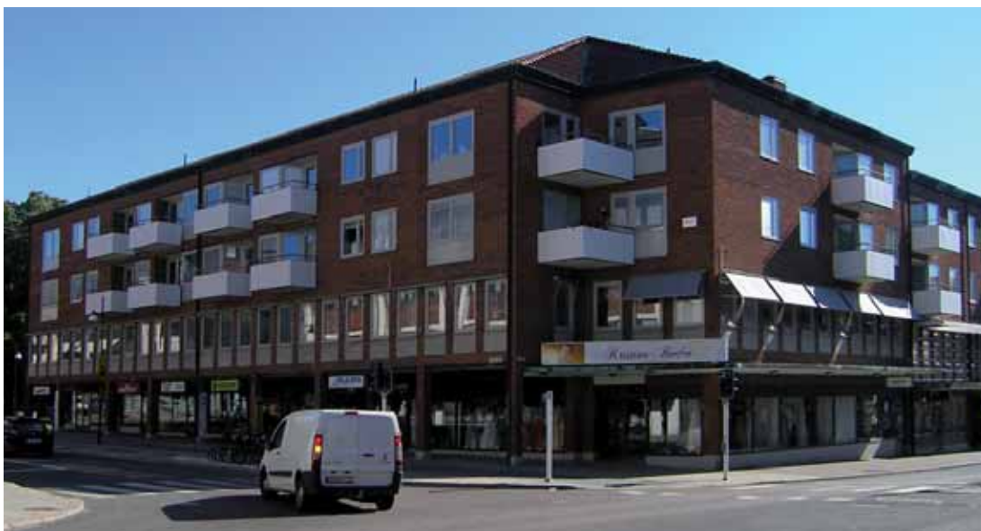
Vale 6 med kontors- och bostadshus stod klart 1966 vid Kungsgatan/Kyrkogatan/Rådmansgatan.

Huvudkaraktären av ståtlig monumentalbyggnad från 1900-talets början består dock fortfarande. Kvarteret i övrigt inrymmer två ytterligare generationer bankbyggnader, dels en från slutet av 1960-talet (se ovan), dels en yngre från sent 1900-tal.