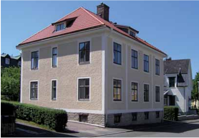
Lärkan 2 Frygiigatan 5 är ett mycket fint prov på en enkel men konsekvent genomförd 1920-talsklassicism.