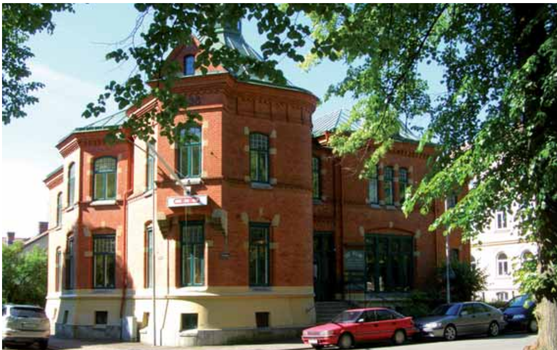
Castor 1, Villagatan 5. Exklusiv tegelvilla från 1898, numera inrymmande Odd Fellows lokaler.