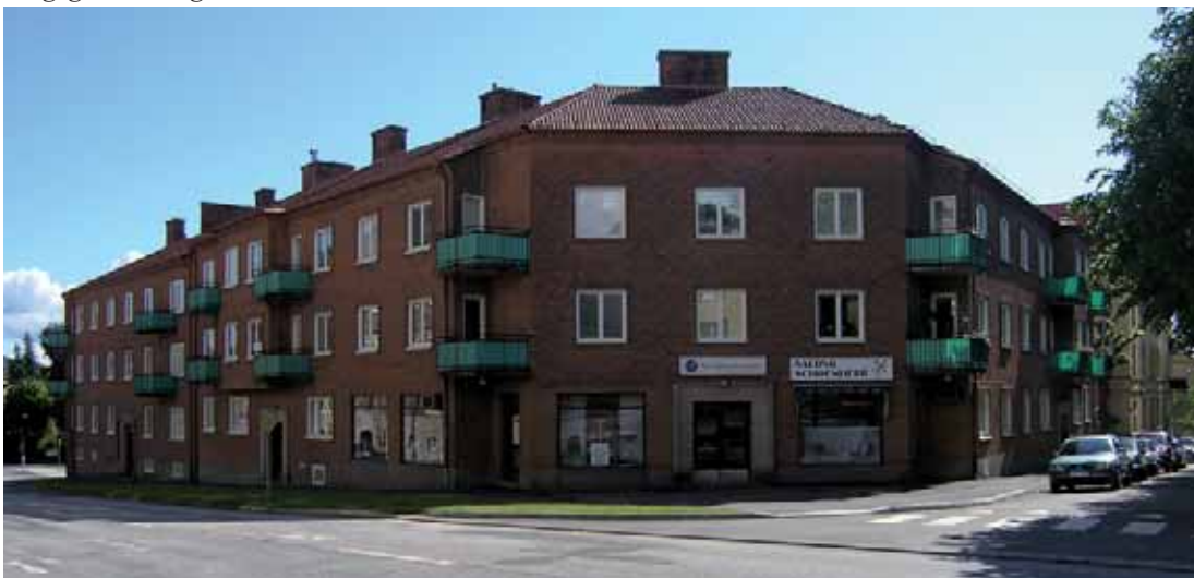
Eken 1 och Eken 3 från 1944-45 bildar tillsammans en mycket välbevarad 1940-talsmiljö vid Skaraborgsgatan/Storgatan.