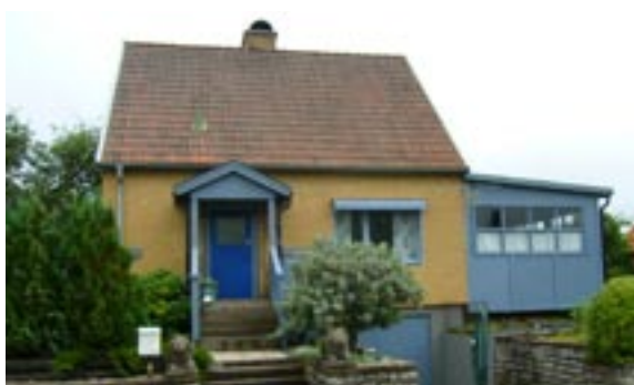
Gärdsgården 4 Hentorpsvägen 39 Enfamiljshus, 5 rok, 1,5-plan + källare 1954 Vetlandahus Byggherre: Einar Brandqvist Ändringar: 1976 Fasadbeklädnad, ____ Målade fönsteromfattningar, Inglasad altan, Ändrad entré, Skorstenskupa, Uthus