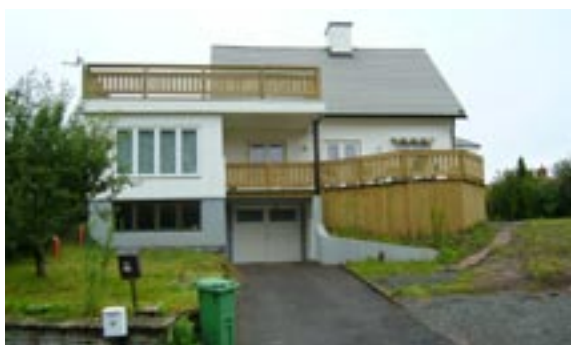
Lyckan 9 Mossvägen 12 Enfamiljshus, 5 rok, 1,5-plan + källare 1953