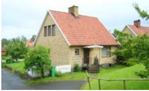
Lyckan 2 Hentorpsvägen 3 Enfamiljshus, 4 rok, 1,5-plan + källare 1955 Borohus, Landsbro Byggherre: G Fäger Ändringar: