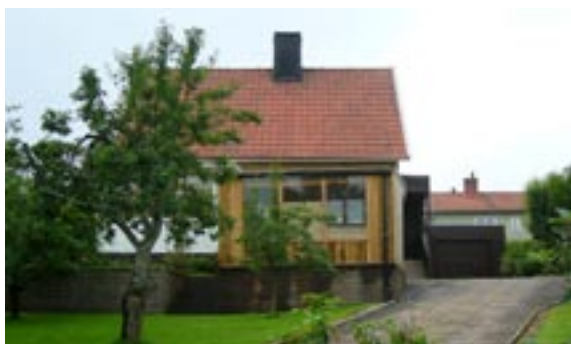
Lyckan 10 Mossvägen 10 Enfamiljshus, 5 rok, 1,5-plan + källare 1953