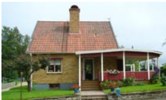
Gärdsgården 3 Hentorpsvägen 37 Enfamiljshus, 5 rok, 1,5-plan + källare 1954 AB Götene Träindustri Byggherre: R Asplind Ändringar: 2002 Tillbyggnad altan, ____ Uthus, Skorstenskupa