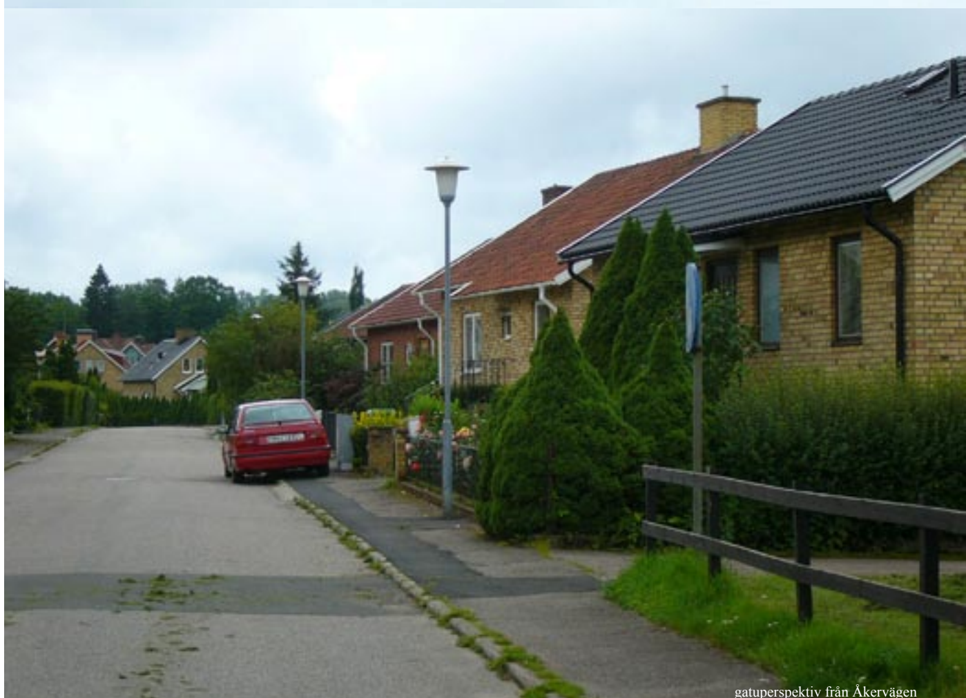
gatuperspektiv från Åkervägen