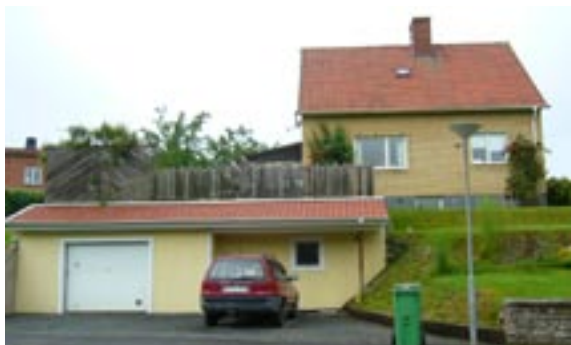
Lyckan 7 Mossvägen 16 Enfamiljshus, 5 rok, 1,5-plan + källare 1953

Byggherre: T Kilström Ändringar: 1956 Staket, 1967 Garage O H Olofsson Arkitektkontor, 1970 Ändrad fasadbeklädnad, 1996 Nybyggnad av garage-skyddsrum samt rivning av garage, ____ Inglasad altan