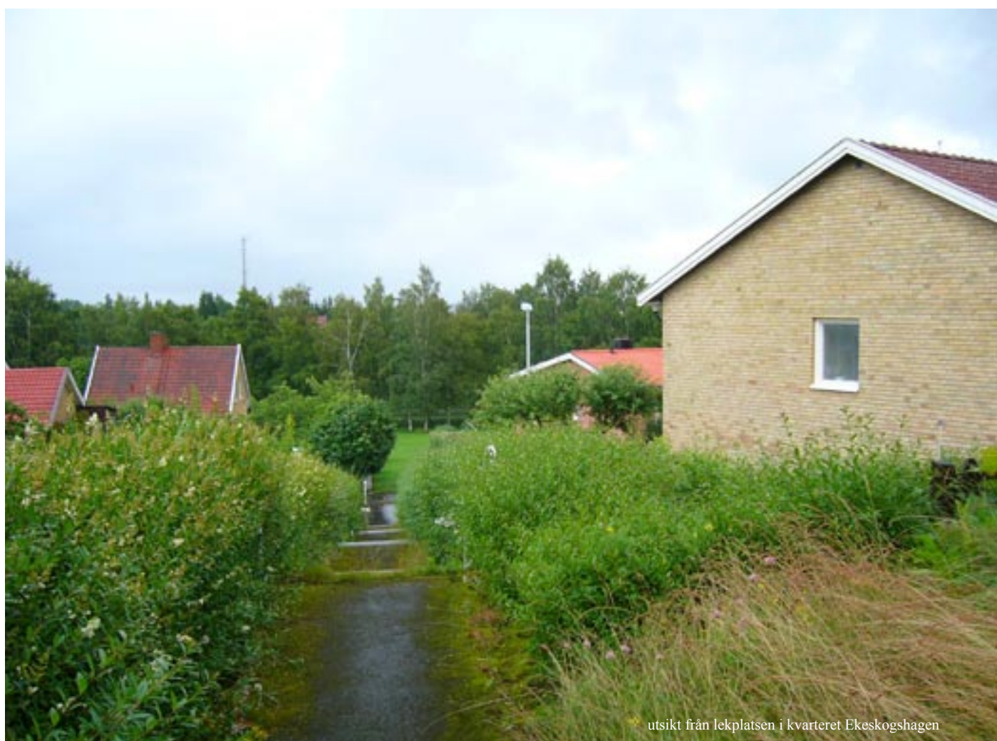
utsikt från lekplatsen i kvarteret Ekeskogshagen