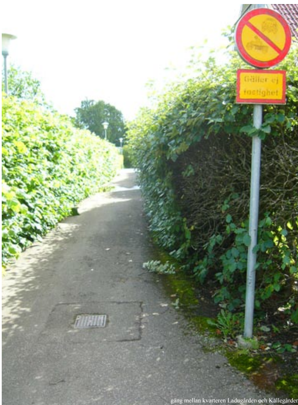
gång mellan kvarteren Ladugården och Källegården