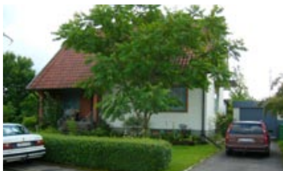
Källegården 5 Åkervägen 13 Enfamiljshus, 5 rok, 1,5-plan + källare 1954 AB Svenska Stenhus, Skövde Byggherre: Gustav Sterngård Ändringar: 1968 Garage AB Svenska Stenhus, 1976 Tillbyggnad, arbetsrum liggande panel