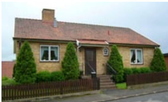
Lyckan 4 Hentorpsvägen 7 Enfamiljshus, 4 rok + källare 1955 Vetlandahus Byggherre: E Axelsson Ändringar: 1959 Staket, ____ Växthus