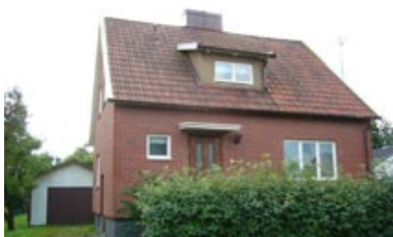
Källegården 6 Åkervägen 15 Enfamiljshus, 4 rok, 1,5-plan + källare 1952 AB Svenska Trähus, Stockholm Byggherre: Erik Andersson Ändringar: 1961 Garage putsad lättbetong och taktegel O H Olofsson Arkitektkontor, 1970 Tillbyggnad, sovrum, hobbyrum fasadtegel och takpapp B Persson, 1975 Fasadbeklädnad, ____ Inklädd skorsten, Eventuellt tilläggsisolering