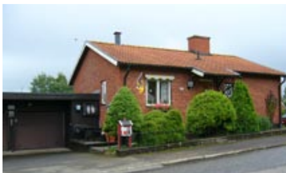
Lyckan 5 Hentorpsvägen 9 Enfamiljshus, 3 rok + källare 1954 Geges Ingenjörbyrå Byggherre: K-E Axelsson Ändringar: 1956 Hägnad, 1978 Garage O H Olofs- son Arkitektkontor, ____ Inglasad altan, Uthus