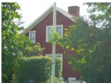
Källegården 4 Åkervägen 11 Enfamiljshus, 6 rok, 1,5-plan + källare Enligt uppgift från boende i området är detta den gamla Källegården som flyttades till den här platsen från andra sidan järnvägen kring år 1859. Ändringar: 1952 VA-installation, 1954 Tillbyggnad, 2000 Tillbyggnad, 2005 Tillbyggnad, ____ Uthus/Lekstuga