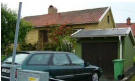
Lyckan 11 Mossvägen 8 Enfamiljshus, 4 rok + källare 1953