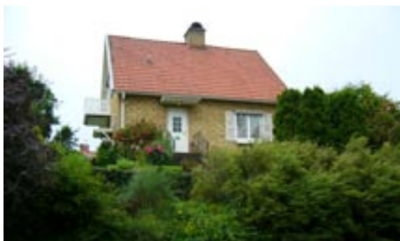
Lyckan 8 Mossvägen 14 Enfamiljshus, 4 rok, 1,5-plan + källare 1954