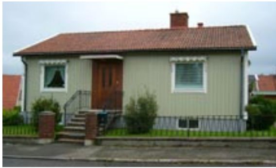
Lyckan 3 Hentorpsvägen 5 Enfamiljshus, 3 rok + källare 1954 AB Götene Träindustri Byggherre: S Gustafsson Ändringar: 1955 Mur och staket, 1964 Förvaring av brandfarlig vara, 1972 Uteplats, ____ Bytta fönster