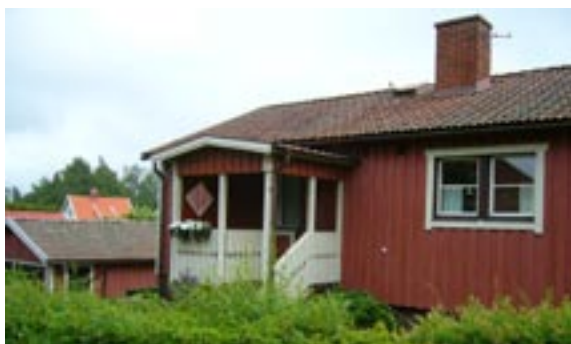
Lyckan 1 Hentorpsvägen 1 Enfamiljshus, 3 rok + källare 1953 Åmåls Sågverks AB Byggherre: Å Boström Ändringar: 1956 Mur och häck, 1980 Garage, Ändring av fasadbeklädnad, 1999 Tillbyggnad, 2007 Tillbyggnad inglasat uterum, ____ Mycket ändrad entré, Eventuellt tilläggsisolering