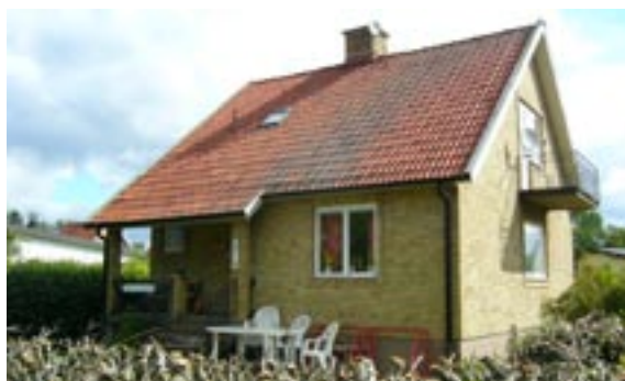
Källegården 2 Åkervägen 7 Enfamiljshus, 4 rok + källare 1954 AB Götene Träindustri Byggherre: B Ericsson Ändringar: 1954 Ändringsarbeten