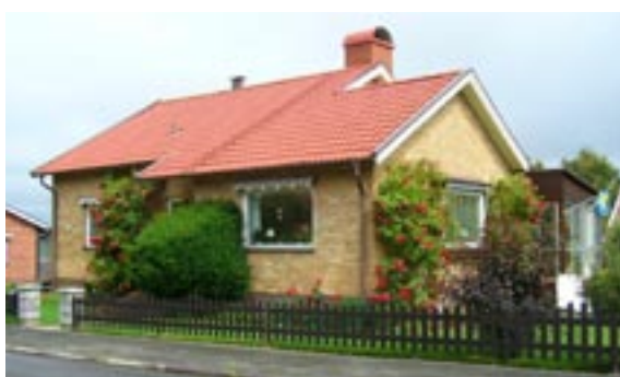
Lyckan 6 Hentorpsvägen 11 Enfamiljshus, 4 rok, 1,5-plan + källare 1954 AB WST-hus Byggherre: L Hultberg Ändringar: 1955 Ändring av terass, 1959 Staket, ____ Skorstenskupa, Nytt tak betongpannor, Bytta fönster, Inglasad altan