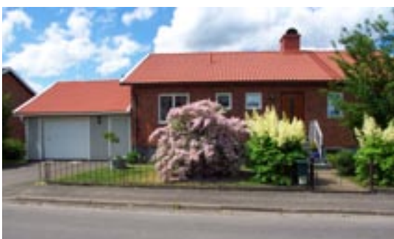
Stenyxan 5 Ringstigen 9 Enfamiljshus, 4 rok + källare 1954 Svenska Lättbetonghus, Göteborg Byggherre: AB Volvo-Pentaverken Ändringar: 1975 Garage, panel, ____ Inglasad altan, Skorstenskupa, Nytt tak betongpannor