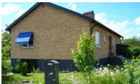
Bronsyxan 9 Ringstigen 18 Enfamiljshus, 4 rok + källare 1955 AB Lättbetonghus, Göteborg Byggherre: AB Volvo-Pentaverken Ändringar: 1960 Mur, ____ Tillbyggnad, bod, Inglasad altan, Skorstenskupa, Förmodligen ej ursprunglig sockelkulör