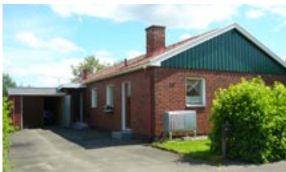
Guldtänen 7 Ringstigen 29 Enfamiljshus, 4 rok, garage i markplan 1961 AB Lättbetonghus, Göteborg Byggherre: AB Lättbetonghus, Göteborg Ändringar: 1976 Fasadbeklädnad, tilläggsisole- ring, rött tegel och lockpanel