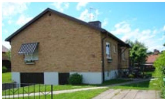
Bronsyxan 8 Ringstigen 16 Enfamiljshus, 4 rok + källare 1955 AB Lättbetonghus, Göteborg Byggherre: AB Volvo-Pentaverken Ändringar: ____ Inglasad altan, Inklädd skorsten