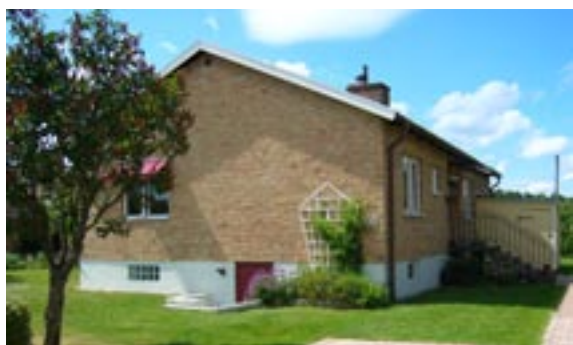
Bronsyxan 10 Ringstigen 20 Enfamiljshus, 4 rok + källare 1955 AB Lättbetonghus, Göteborg Byggherre: AB Volvo-Pentaverken Ändringar: 1965 och 1969 Förvaring av brandfar- lig vara, ____ Igensättning av garageport, glasbe- tongfönster, Utbyggnad, bod, Inglasad altan