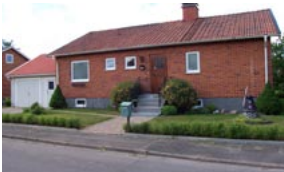
Stenyxan 4 Ringstigen 7 Enfamiljshus, 4 rok + källare 1954 Svenska Lättbetonghus, Göteborg Byggherre: AB Volvo-Pentaverken Ändringar: 2001 Tillbyggnad, inglasad altan, 2002 Garage ____ Nya fönster, Skorstenskupa