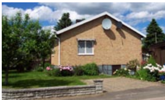
Guldtenen 1 Ringstigen 17 Enfamiljshus, 4 rok + källare 1955 AB Lättbetonghus, Göteborg Byggherre: AB Volvo-Pentaverken Ändringar: 1987 Garage i markplan, trälockpanel, papptak, Igensatt källargarageport, ____ Inglasad altan, Skorstenskupa, Tydligt synliga nya plåtvindskivor