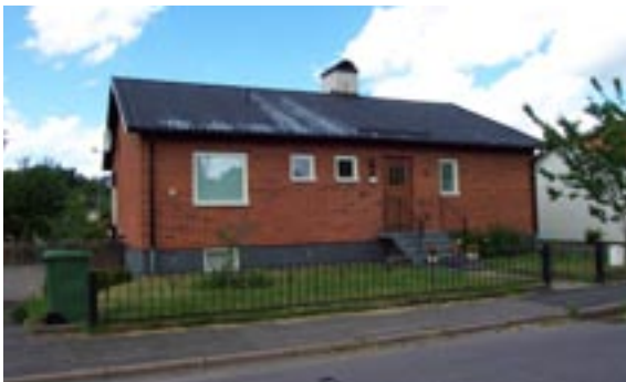
Stenyxan 3 Ringstigen 5 Enfamiljshus, 4 rok + källare 1954 Svenska Lättbetonghus, Göteborg Byggherre: AB Volvo-Pentaverken Ändringar: ____ Skorstenskupa, Putsad skorsten, Nya fönster, Nytt plåttak