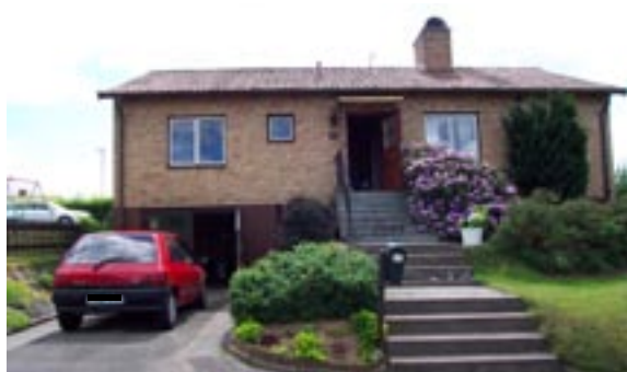
Bronsyxan 7 Ringstigen 14 Enfamiljshus, 4 rok + källare 1955 AB Lättbetonghus, Göteborg Byggherre: AB Volvo-Pentaverken Ändringar: ____ Inglasad altan, Skorstenskupa