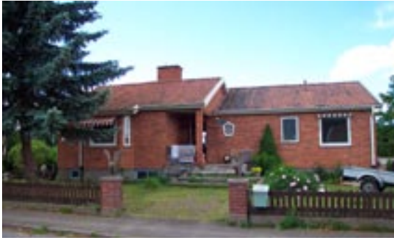
Stenyxan 1 Ringstigen 1 Enfamiljshus, 5 rok 1955 Vetlandahus Byggherre: A Borg Ändringar: Nytt altanräcke