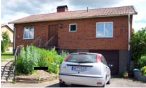
Bronsyxan 2 Ringstigen 4 Enfamiljshus, 4 rok + källare 1954 Svenska Lättbetonghus, Göteborg Byggherre: AB Volvo-Pentaverken Ändringar: 1960 Kalkstensmur, ____ Skor- stenskupa