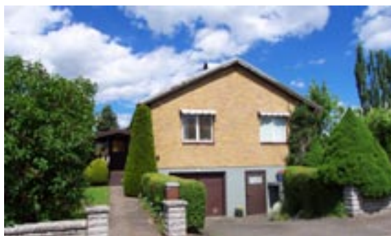
Guldtenen 2 Ringstigen 19 Enfamiljshus, 3 rok + källare 1960 AB Svenska Stenhus, Skövde Byggherre: Thorild Bergström Ändringar: 1963 Förvaring av brandfarlig vara, 2003 Tillbyggnad, stående träpanel