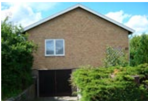
Bronsyxan 12 Ringstigen 24 Enfamiljshus, 4 rok + källare 1955 AB Lättbetonghus, Göteborg Byggherre: AB Volvo-Pentaverken Ändringar: ____ Altan, Skorstenskupa