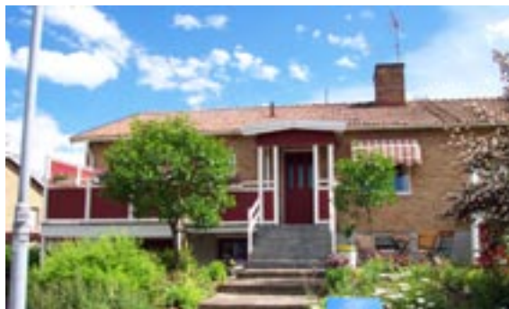
Bronsyxan 4 Ringstigen 8 Enfamiljshus, 4 rok + källare 1955 AB Lättbetonghus, Göteborg Byggherre: AB Volvo-Pentaverken Ändringar: ____ Altan, entré, Tillbyggnad, Mycket ändrad entré Entréaltanen ändrar starkt gatufasaden