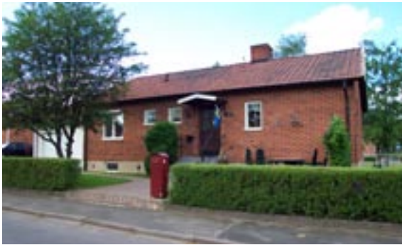
Stenyxan 2 Ringstigen 3 Enfamiljshus, 4 rok + källare 1954 Svenska Lättbetonghus, Göteborg Byggherre: AB Volvo-Pentaverken Ändringar: 1954 Mur, 1967 Garage i markplan, panel, ____ Inglasad altan