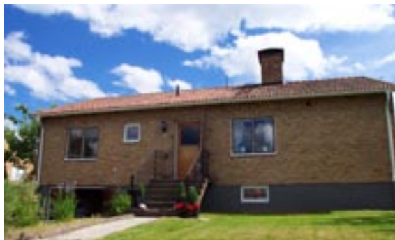
Bronsyxan 5 Ringstigen 10 Enfamiljshus, 4 rok + källare 1955 AB Lättbetonghus, Göteborg Byggherre: AB Volvo-Pentaverken Ändringar: 1959 Mur, ____ Tillbyggnad, Skor- stenskupa