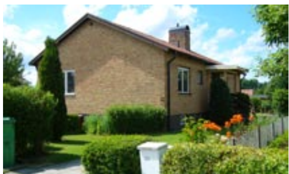
Bronsyxan 11 Ringstigen 22 Enfamiljshus, 4 rok + källare 1955 AB Lättbetonghus, Göteborg Byggherre: AB Volvo-Pentaverken Ändringar: 1960 Häck med grind, 1999 Garage, 2005 Tillbyggnad, stående träpanel, vet ej om utförd, ____ Mycket ändrad entré, Skorstenskupa