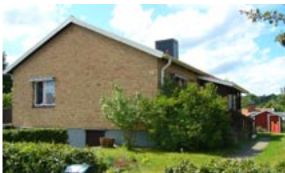
Bronsyxan 13 Ringstigen 26 Enfamiljshus, 4 rok + källare 1955 AB Lättbetonghus, Göteborg Byggherre: AB Volvo-Pentaverken Ändringar: 1992 Utbyggnad, stående panel, ____ Mycket ändrad entré, Inglasad altan, Nytt tak röda betongpannor, Inklädd skorsten