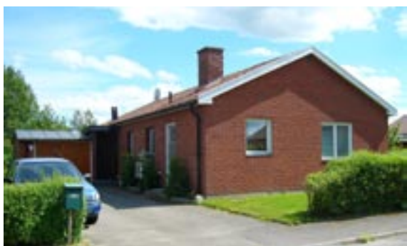
Guldtänen 6 Ringstigen 27 Enfamiljshus, 4 rok, garage i markplan 1961 AB Lättbetonghus, Göteborg Byggherre: AB Lättbetonghus, Göteborg Ändringar: 1964 Förvaring av brandfarlig vara, 1975 Altan, byte av befintligt perspektivfönster ___ Delvis utbytta fönster