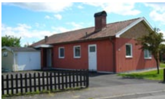
Guldtänen 8 Ringstigen 31 Enfamiljshus, 4 rok, garage i markplan 1961 AB Lättbetonghus, Göteborg Byggherre: AB Lättbetonghus, Göteborg Ändringar: 1964 Förvaring av brandfarlig vara ___ Inklädd skorsten, Inklädd sockel