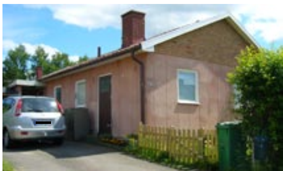
Guldtänen 5 Ringstigen 25 Enfamiljshus, 4 rok, garage i markplan 1961 AB Lättbetonghus, Göteborg Byggherre: AB Lättbetonghus, Göteborg Ändringar: 1964 Förvaring av brandfarlig vara