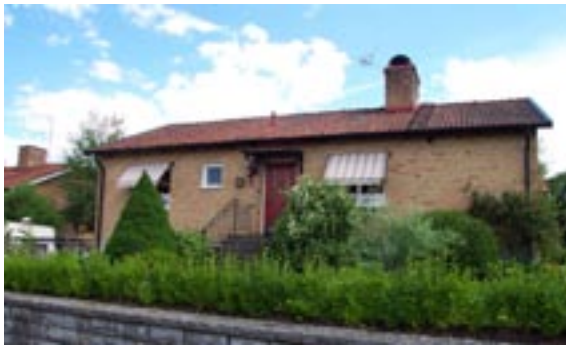
Bronsyxan 3 Ringstigen 6 Enfamiljshus, 4 rok + källare 1955 AB Lättbetonghus, Göteborg Byggherre: AB Volvo-Pentaverken Ändringar: 1960 Mur, låg, kalksten, 1980 Mur, ____ Tillbyggnad, Skorstenskupa