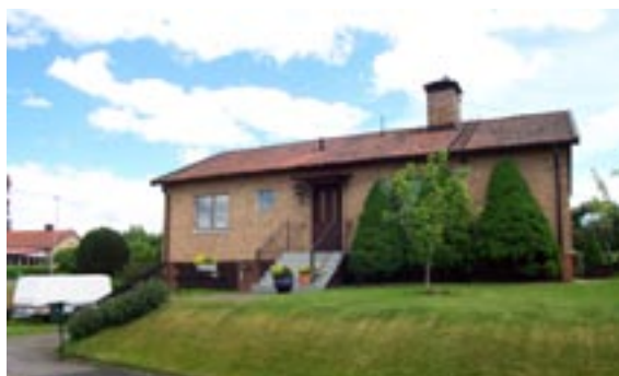
Bronsyxan 6 Ringstigen 12 Enfamiljshus, 4 rok + källare 1955 AB Lättbetonghus, Göteborg Byggherre: AB Volvo-Pentaverken Ändringar: ____ Skorstenskupa, Nya fönsterbleck