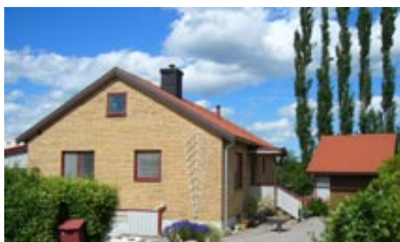
Guldtenen 3 Ringstigen 21 Enfamiljshus, 4 rok + källare 1962 AB ____ Byggherre: Börje Åberg Ändringar: 1975 Garage och altan, skivkådsel, Harald Ferm Arkitektkontor, Skövde, 2004 Instal- lation av braskamin, 2005 Inglasad altan, ____ Igensatt källargarageport, Mycket ändrad entré