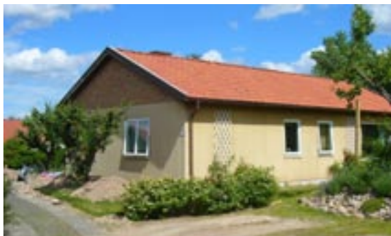
Guldtänen 4 Ringstigen 23 Enfamiljshus, 4 rok, garage i markplan 1961 AB Lättbetonghus Byggherre: AB Lättbetonghus Ändringar: 1963 Förvaring av brandfarlig vara ___ Delvis utbytta fönster