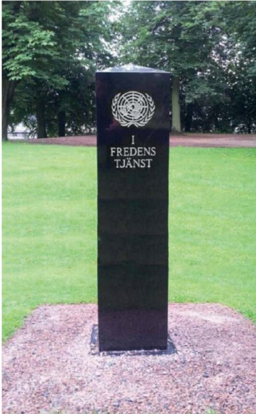
Bild 2. Utformning veteranmonument

Utseende för det framtagna monumentet är hämtat från ett befintligt monument och har arbetats vidare med i samråd med Fredsbaskrarna Skaraborg. Utseende enligt bild 2.