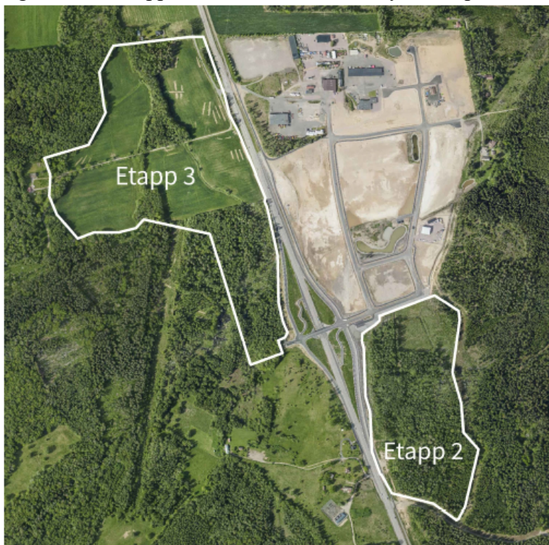
Avgränsning av planområdet för etapp 2 och etapp 3.

Etapp 2 ansluter direkt söderut från etapp 1. Etapp 3 ligger i höjd med etapp 1, väster om väg 26. Båda etapperna får infart från den nya trafikplatsen vid väg 26.