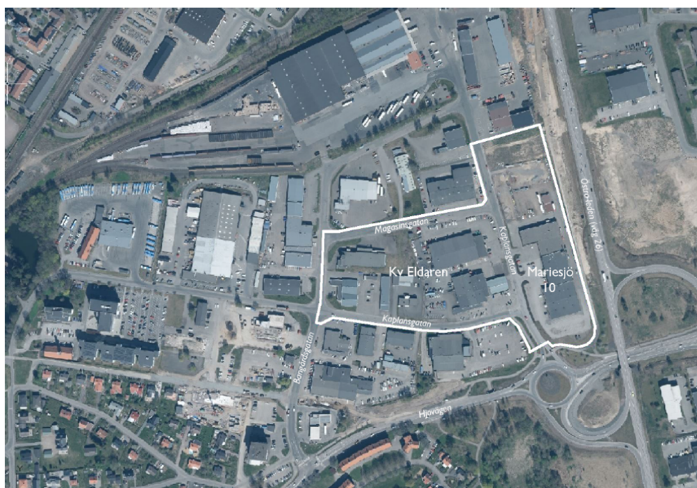
Översikt och gräns för planområdet

Planens huvuddrag är att möjliggöra för en utveckling i enlighet med Planprogram för Mariesjö. Stadsdelen Mariesjö ska omvandlas från industri- och verksamhetsområde till kvartersstad med blandat innehåll. Ett genomförande av planen tillgodoser behovet av en ny högstadieskola, nya bostäder i centralt läge, samt servicefunktioner såsom dagligvarubutik och idrottshall.