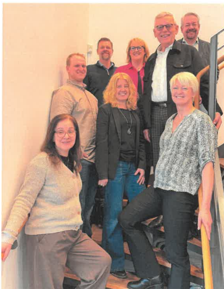
Next Skövdes styrelse

Det finns inga väsentliga händelser efter räkenskapsårets slut.