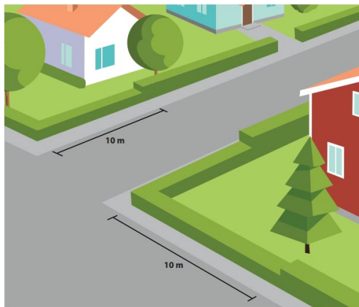
Figur 1 Siktriangel 10 meter från korsning